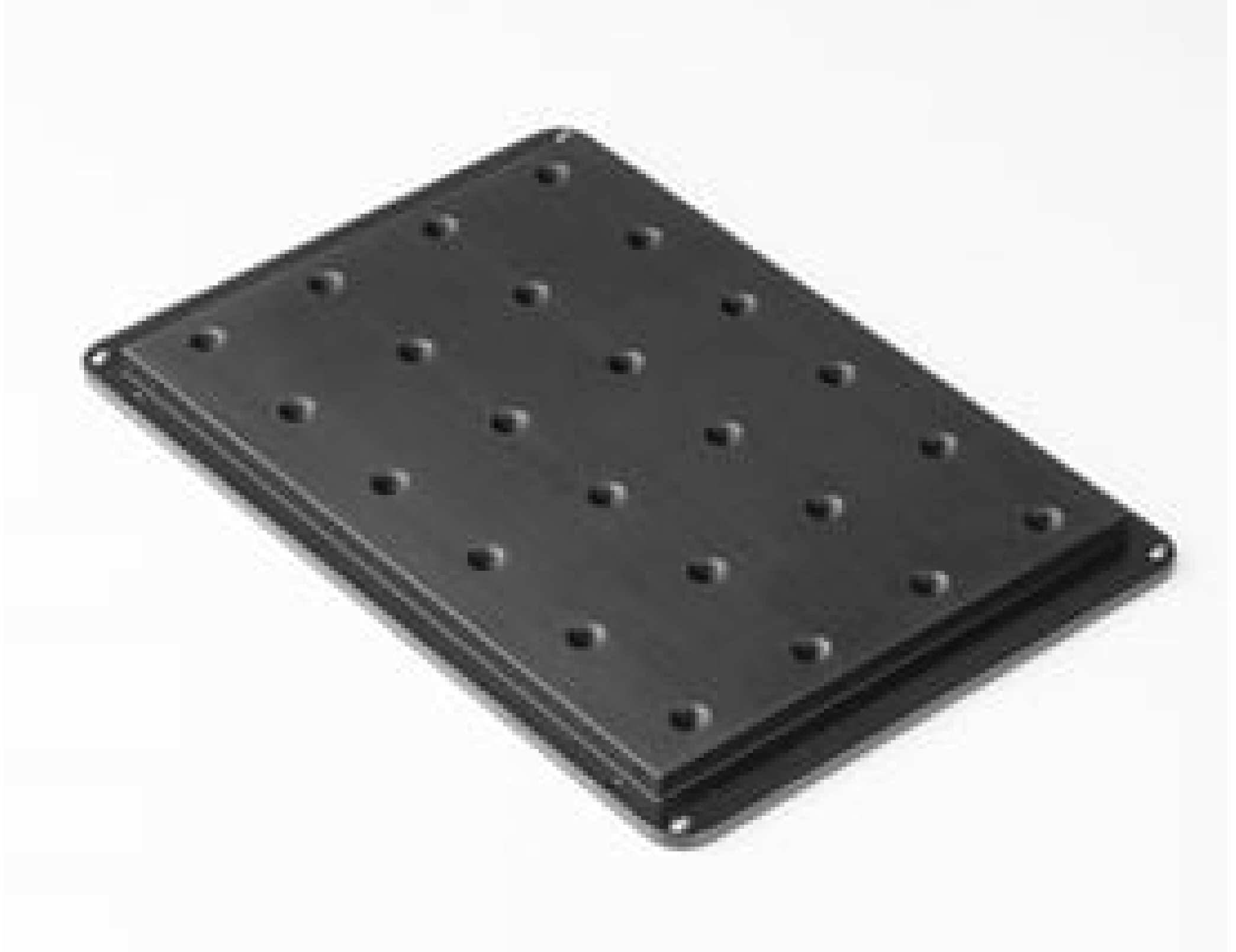
XY Microscope Stage Insert, Breadboard