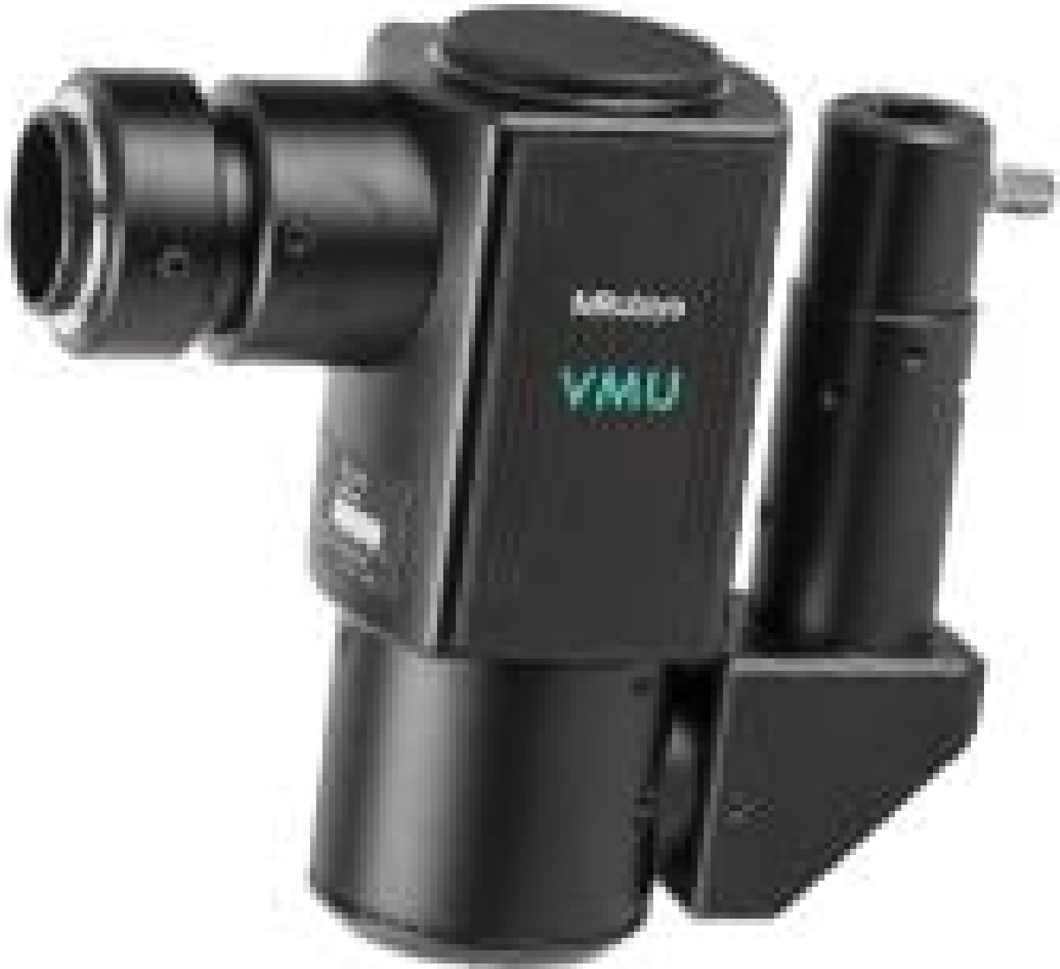
VIS-NIR Horizontal Mitutoyo Video Microscope Unit, #89-621