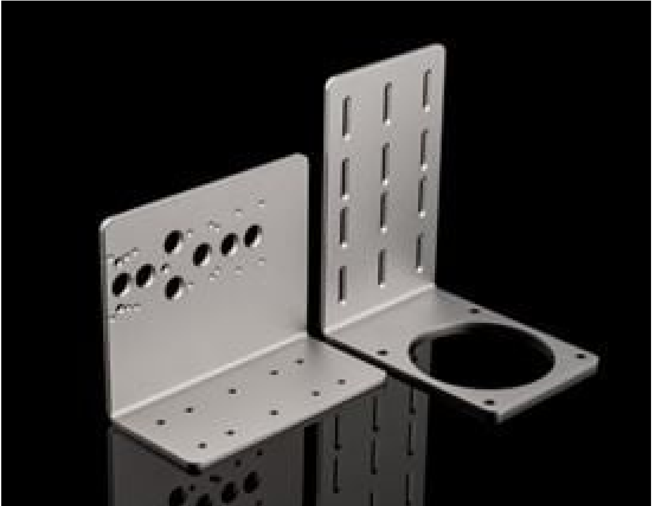
Vertical Mbunting Bracket, #34-867