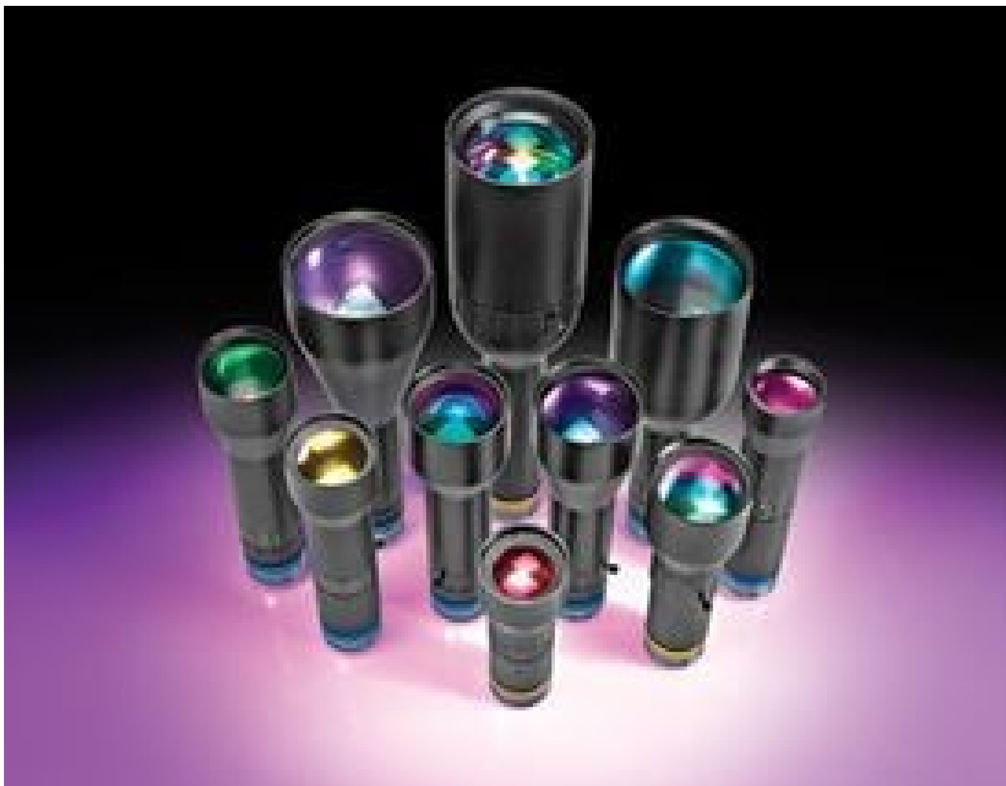
SilverTL™ Telecentric Lenses