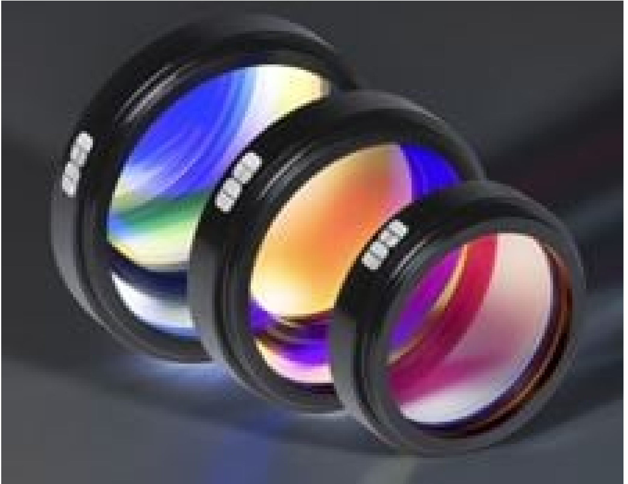
TECHSPEC® High Performance Mounted Machine Vision Filters