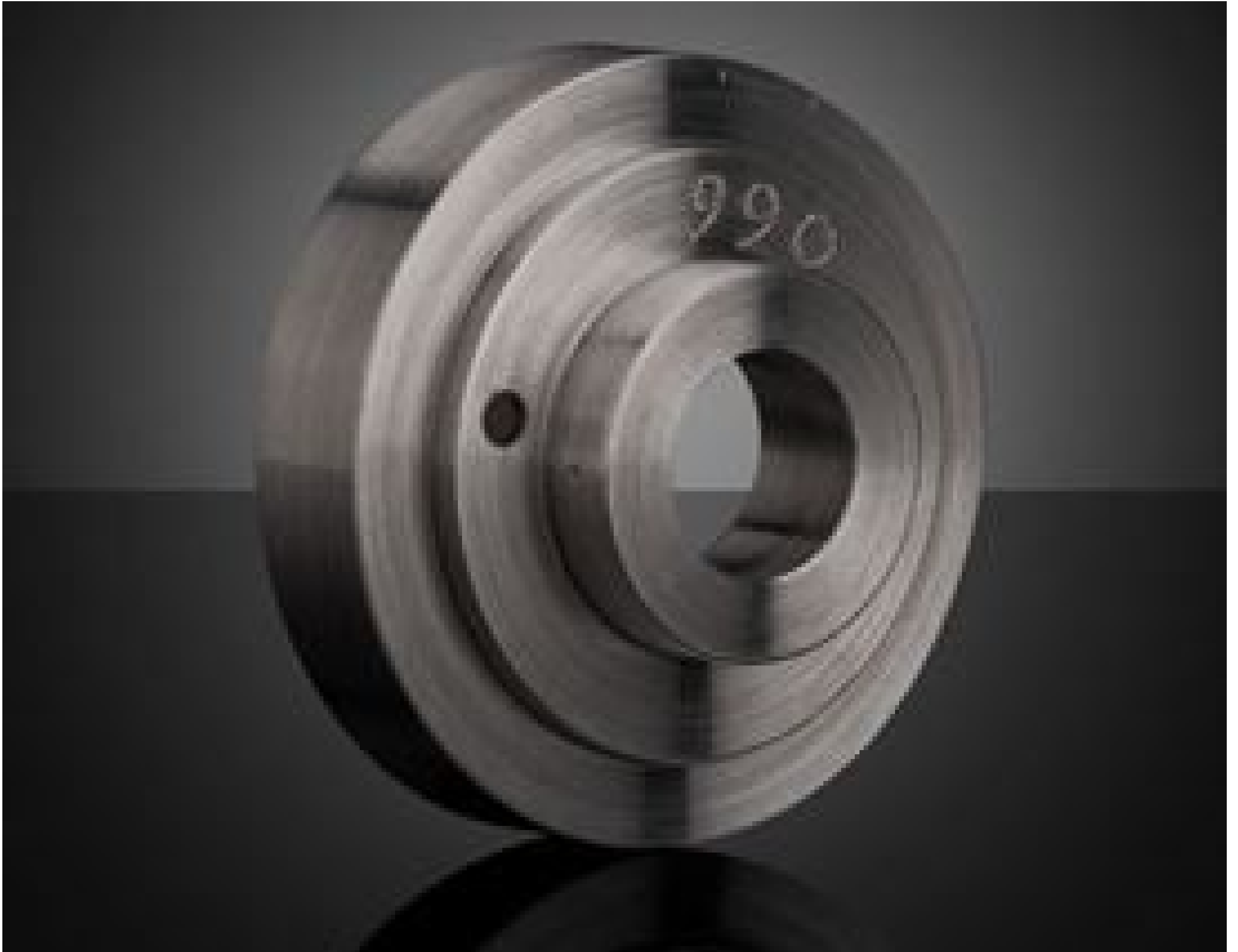
SugarCUBE™ Light Guide Adapter - 66 (#66-308)