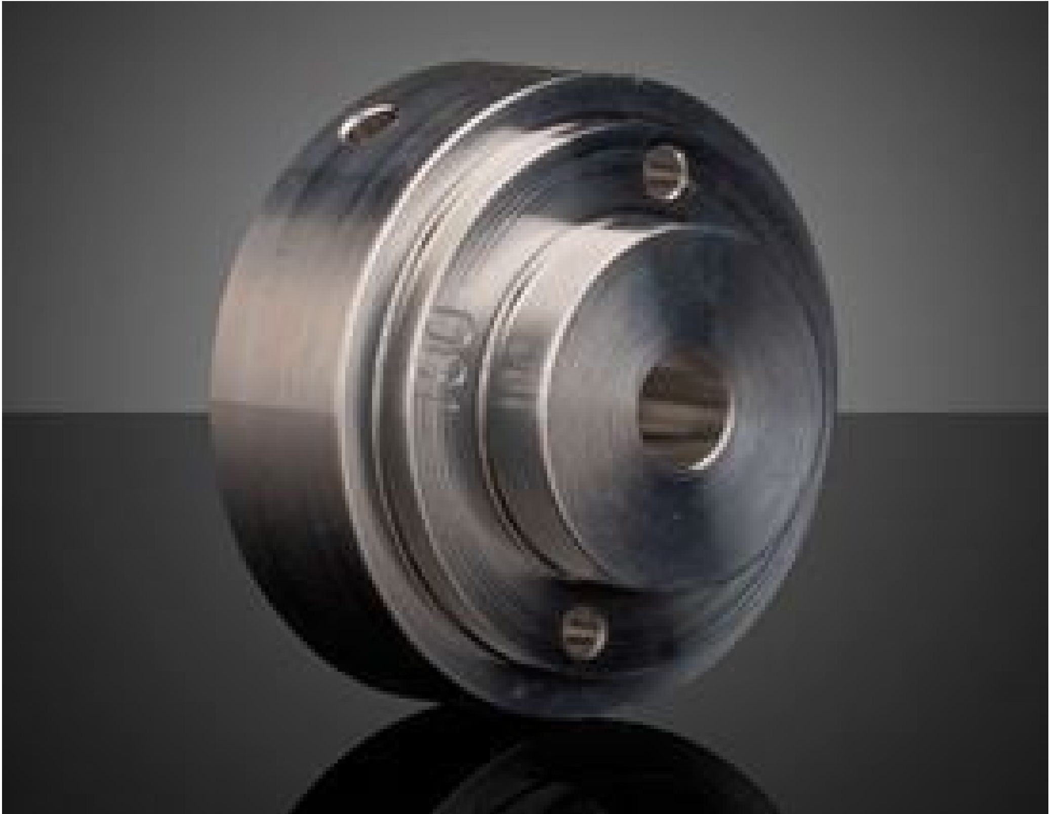
SugarCUBE™ Light Guide Adapter - 3mm (#13-536)