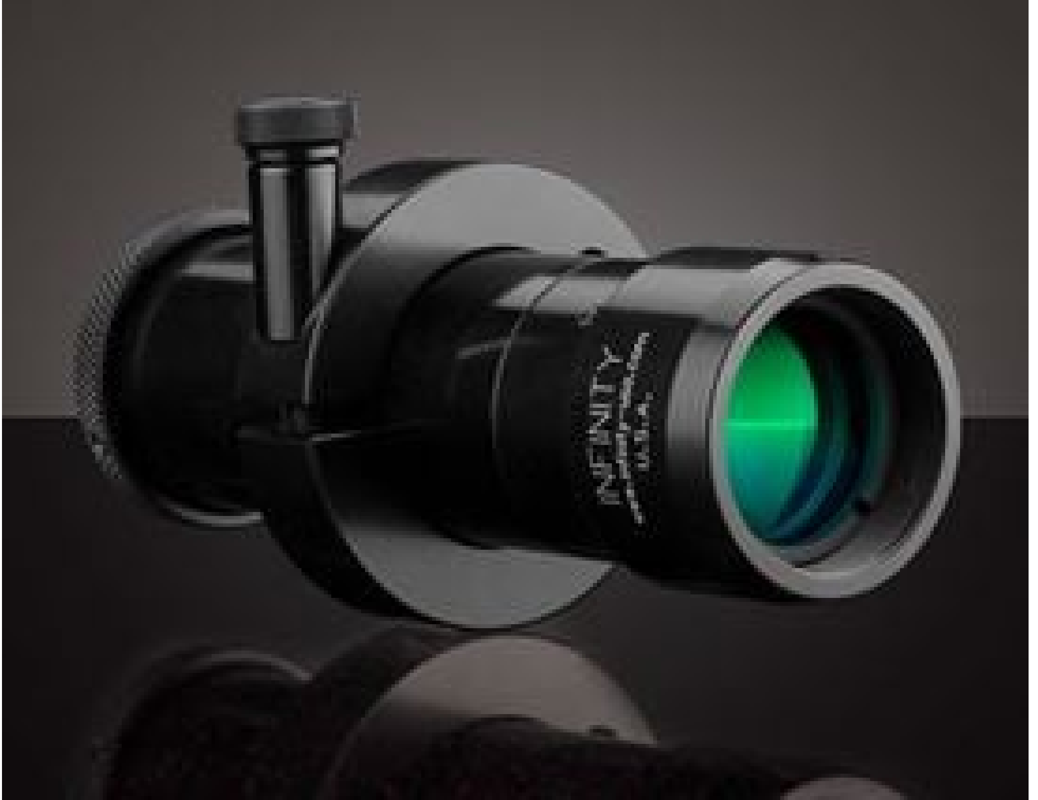
Standard (with no In-Line Attachment), InfiniTube, #56-125

See More by Infinity Photo-Optical Company