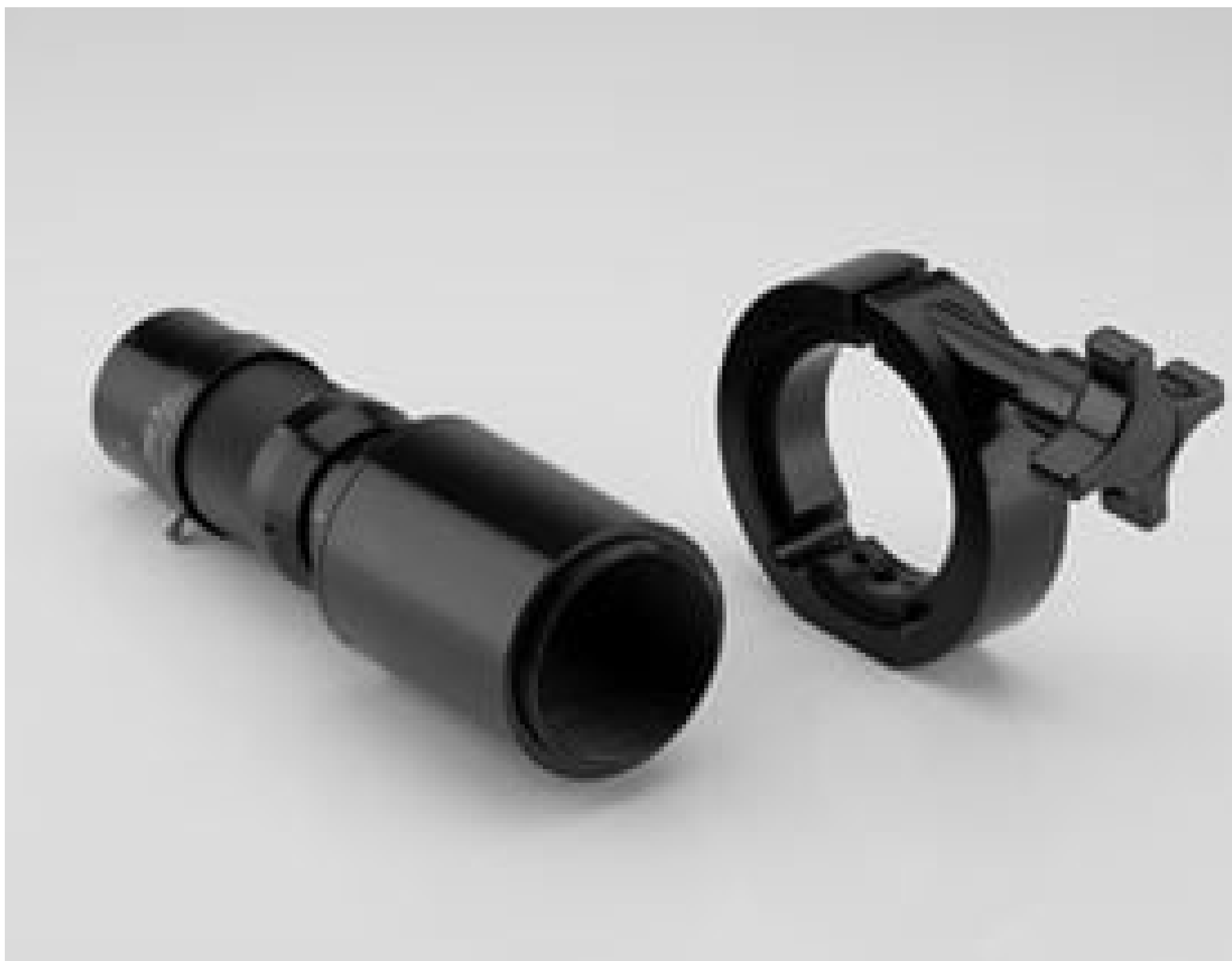
#86-890: ST Main Body with Iris, T-Mount, KC VideoMax