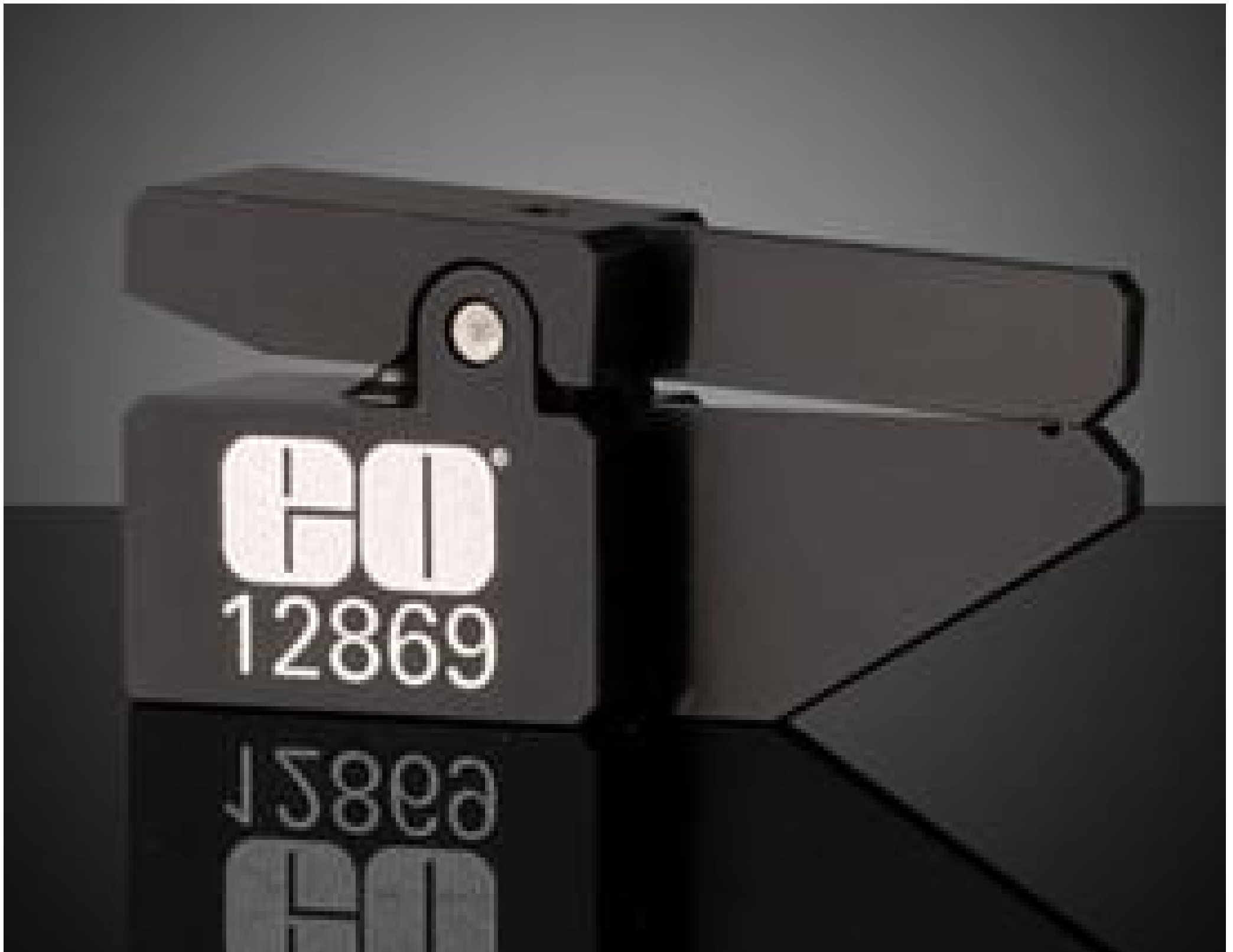
Small Lens Clamp for 1-3mm Dia. Optics, #12-869