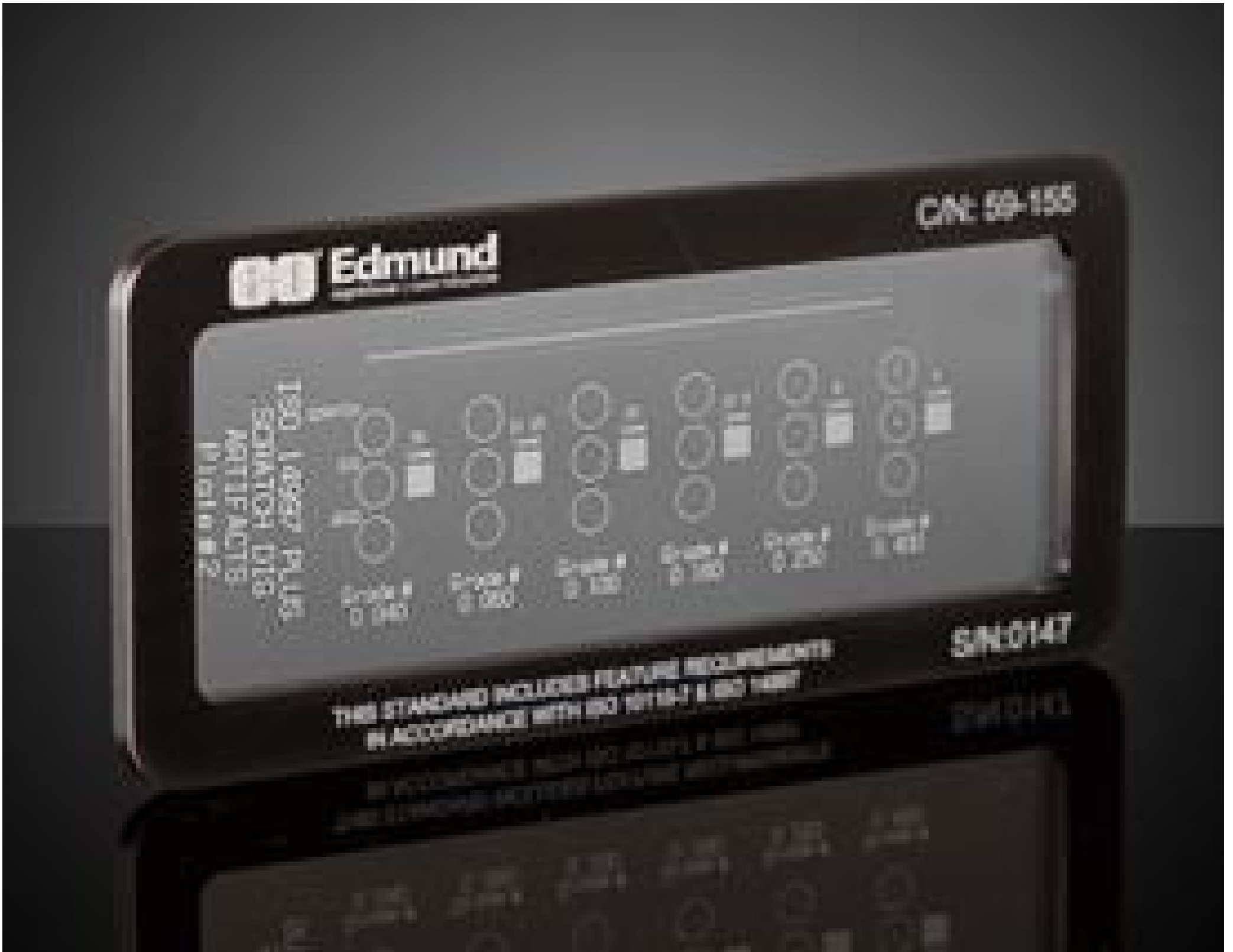
Scratch & Dig Target (2nd Surface Positive), #59-155