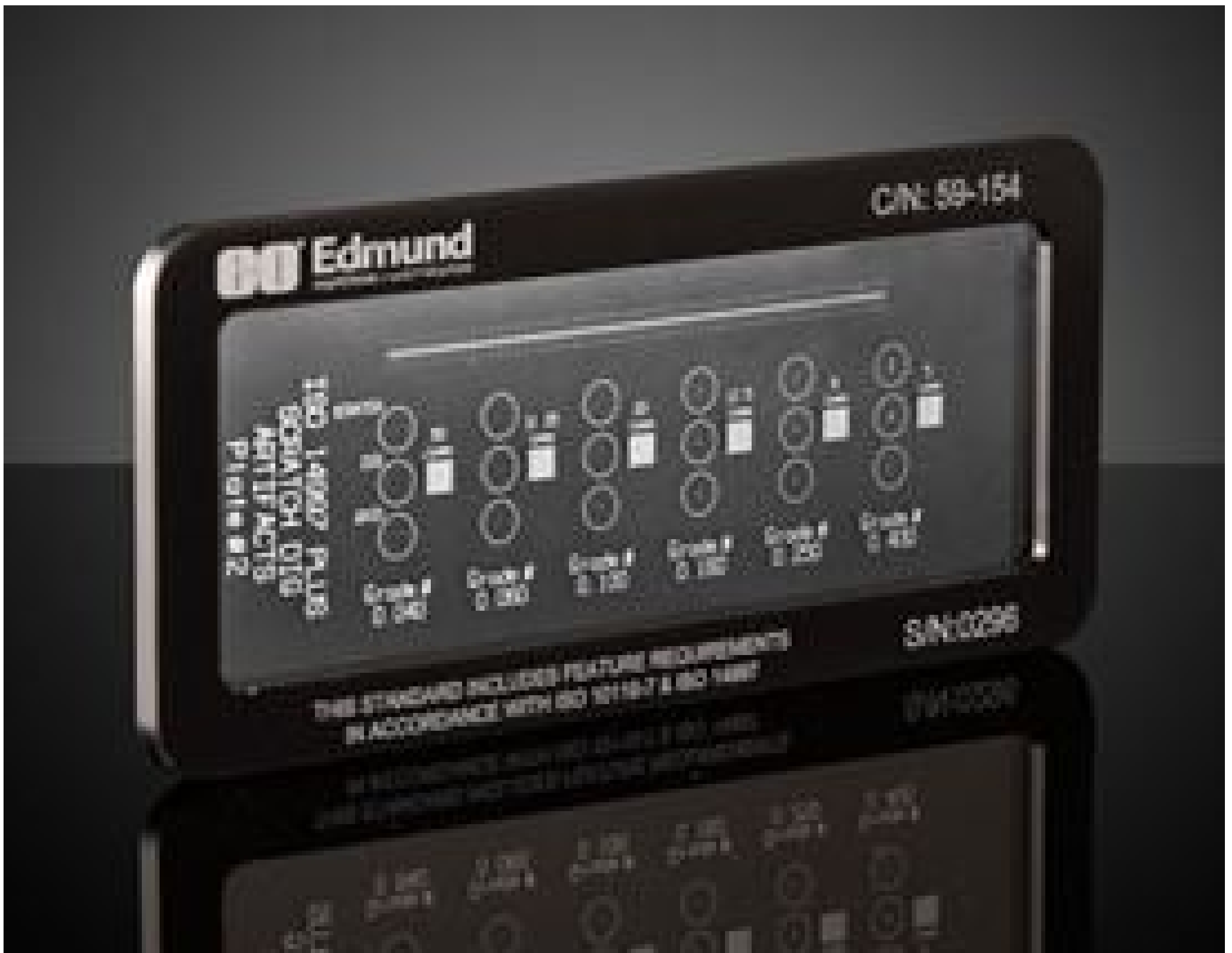
Scratch & Dig Target (1st Surface Positive), #59-154