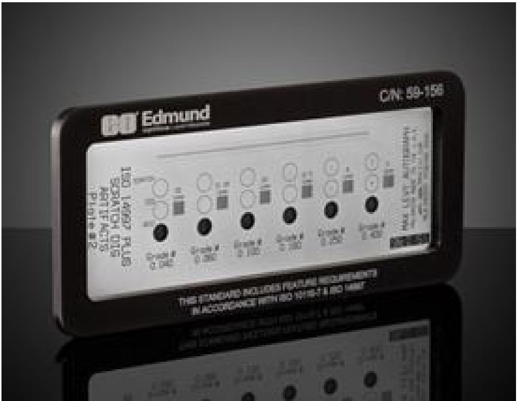
Scratch & Dig Target (1st Surface Negative), #59-156