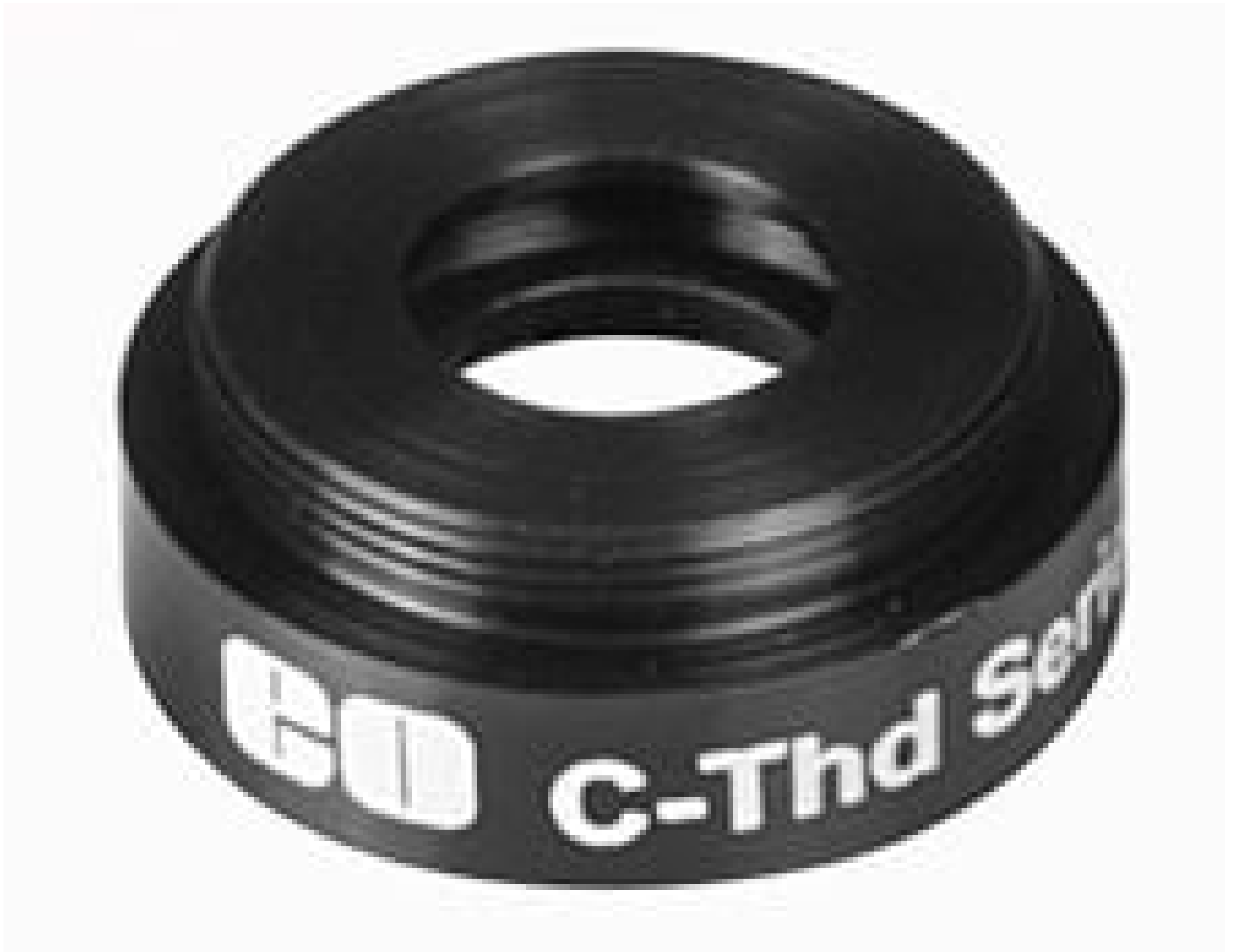
C-Mount to TO-8 Detector Mount, #58-733