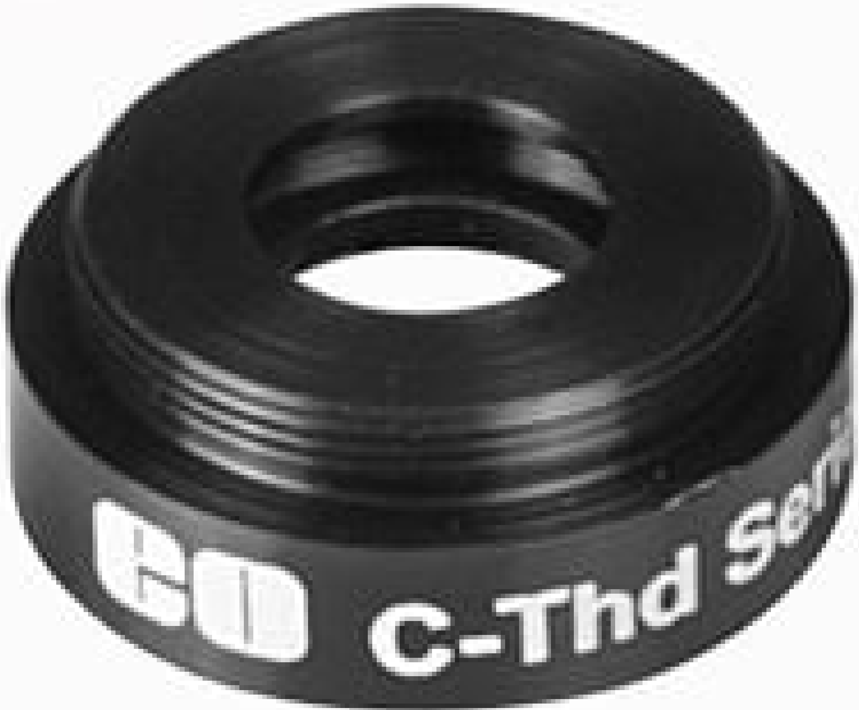
C-Mount to TO-8 Detector Mount, #58-733