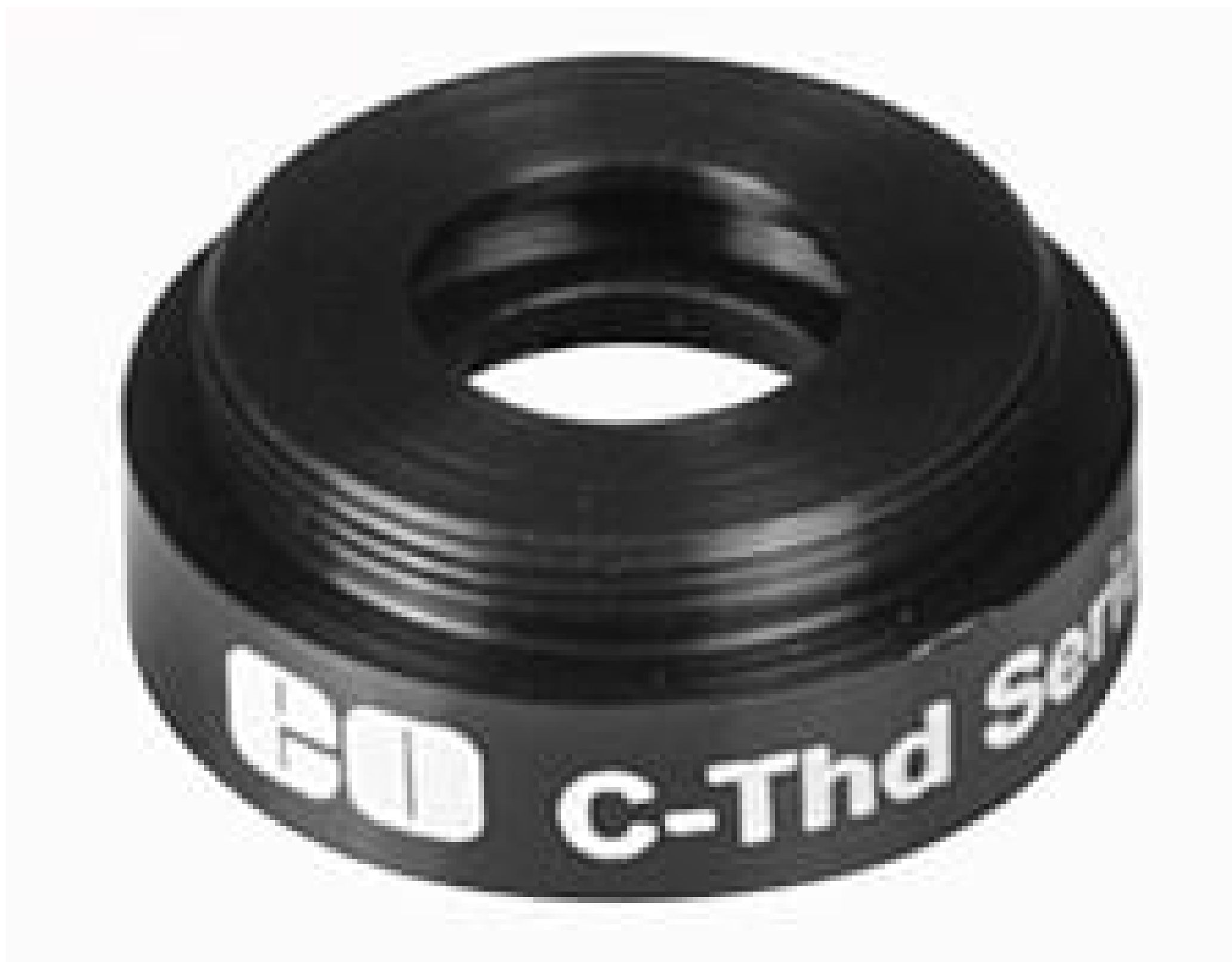
C-Mount to TO-8 Detector Mount, #58-733