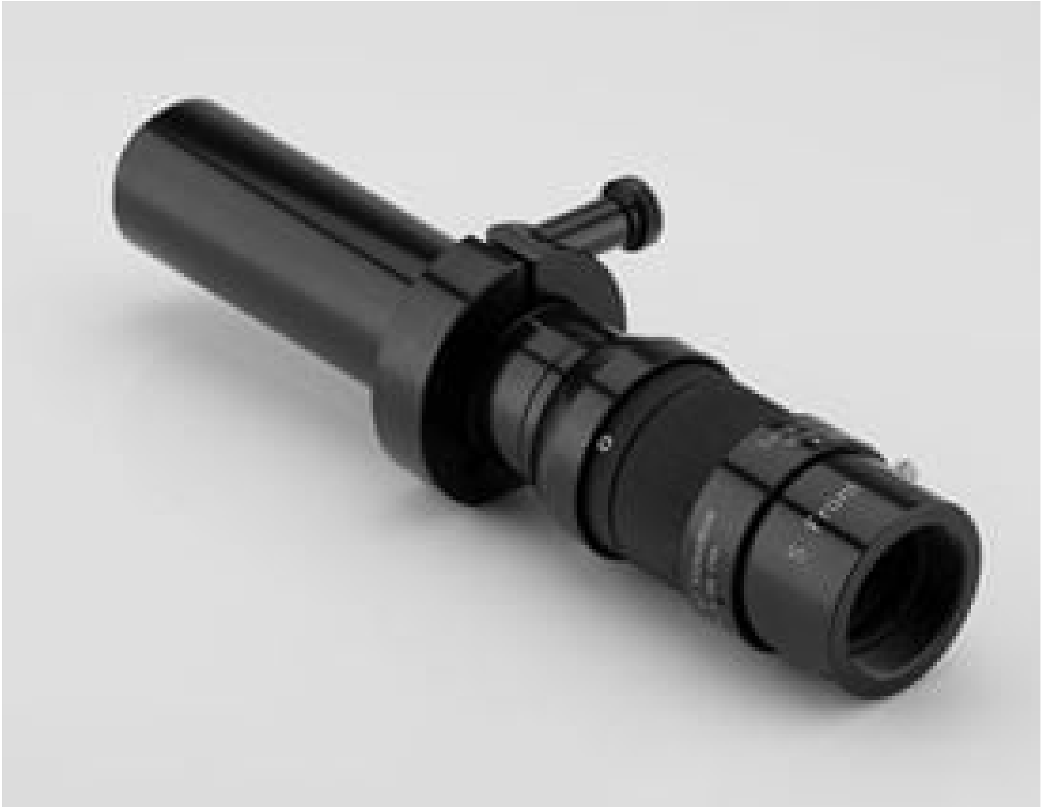
#86-889: S Main Body, C-Mount, KC VideoMax