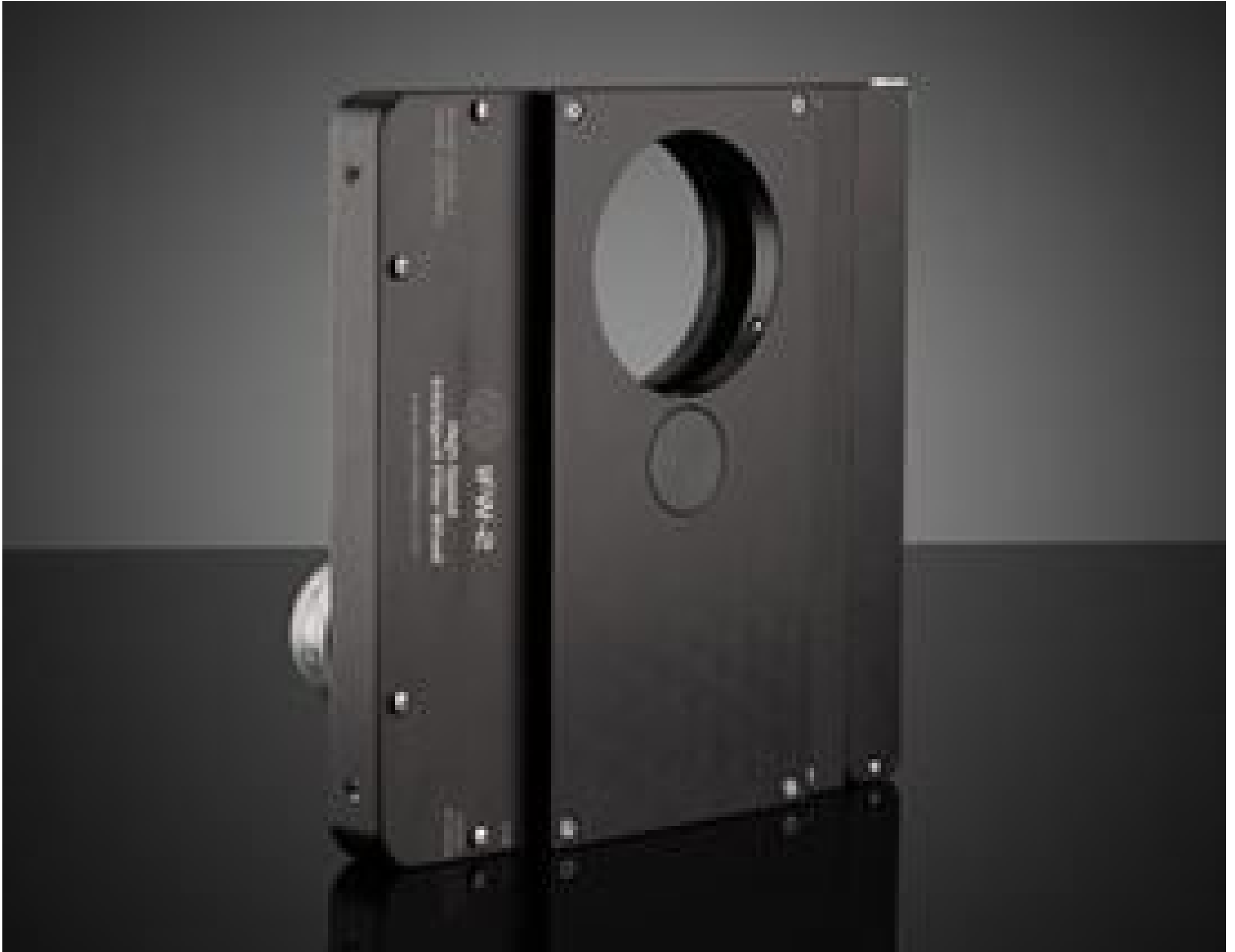
Motorized Filter Wheels