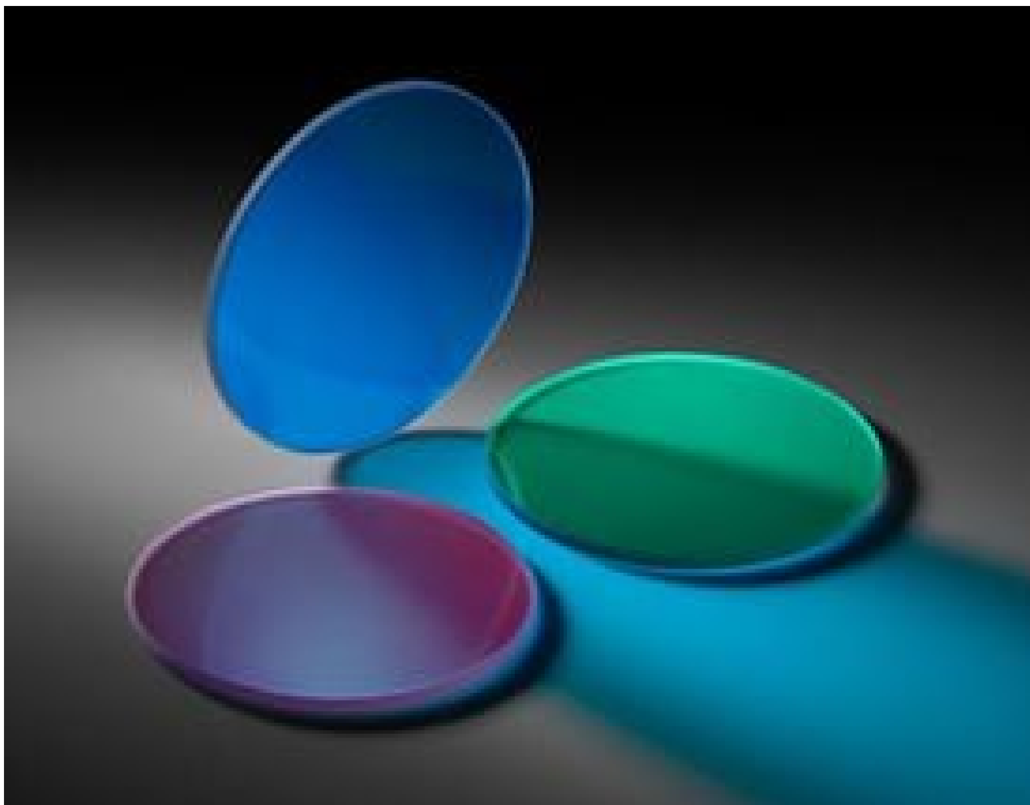
Red, Green, and Blue Dichroic Filter Set