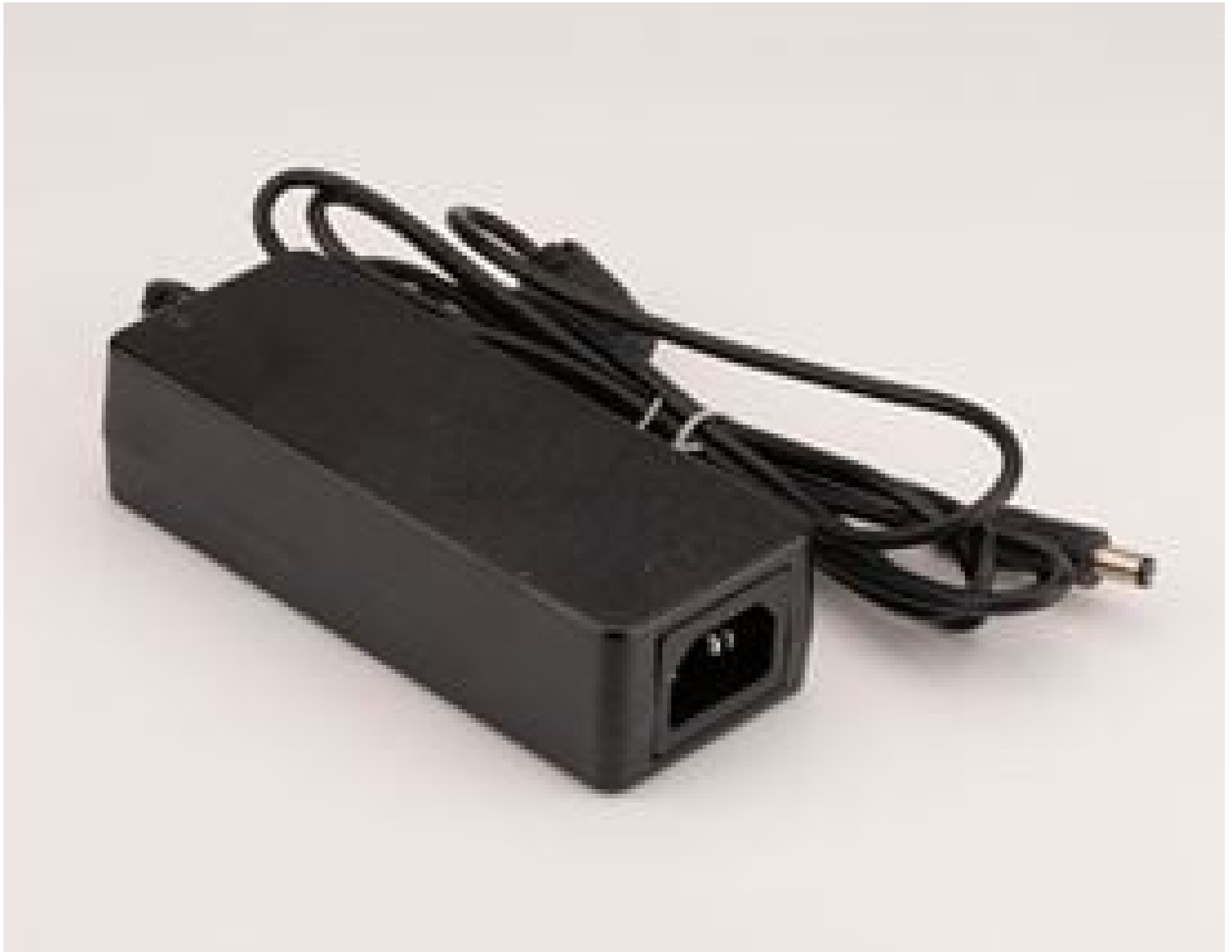
#16-791: Power Supply for SCHOTT VisiLED Ringlights