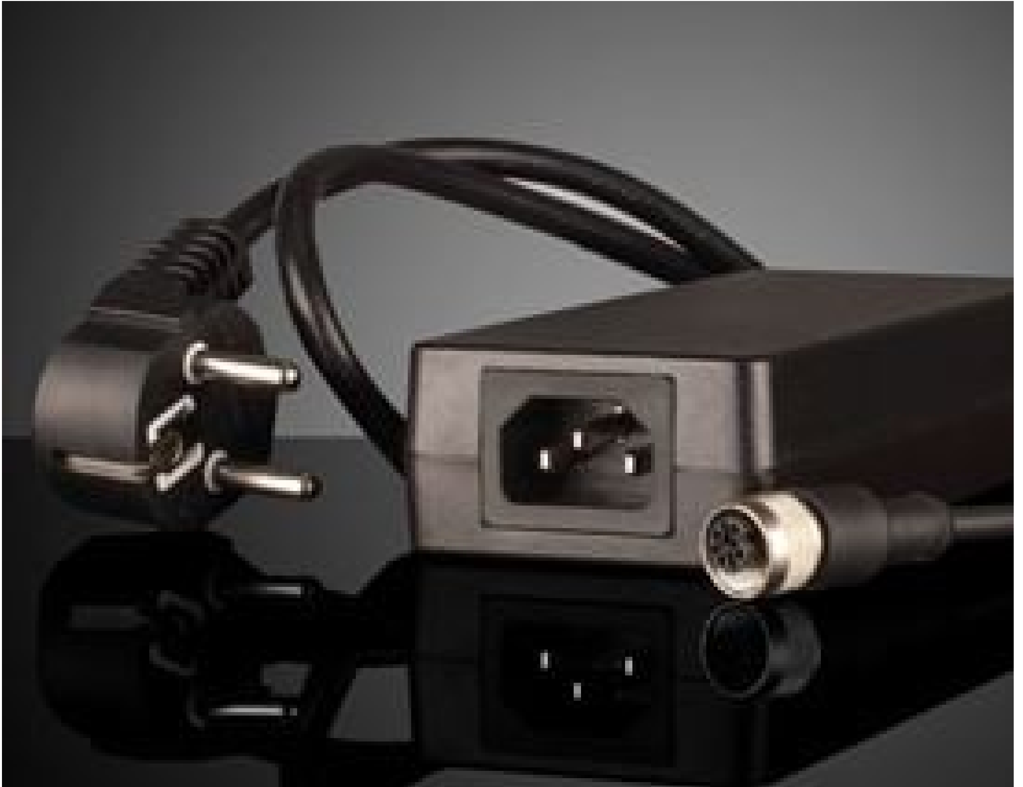
Power Supply for Effilux LED Lights, EU Adapter