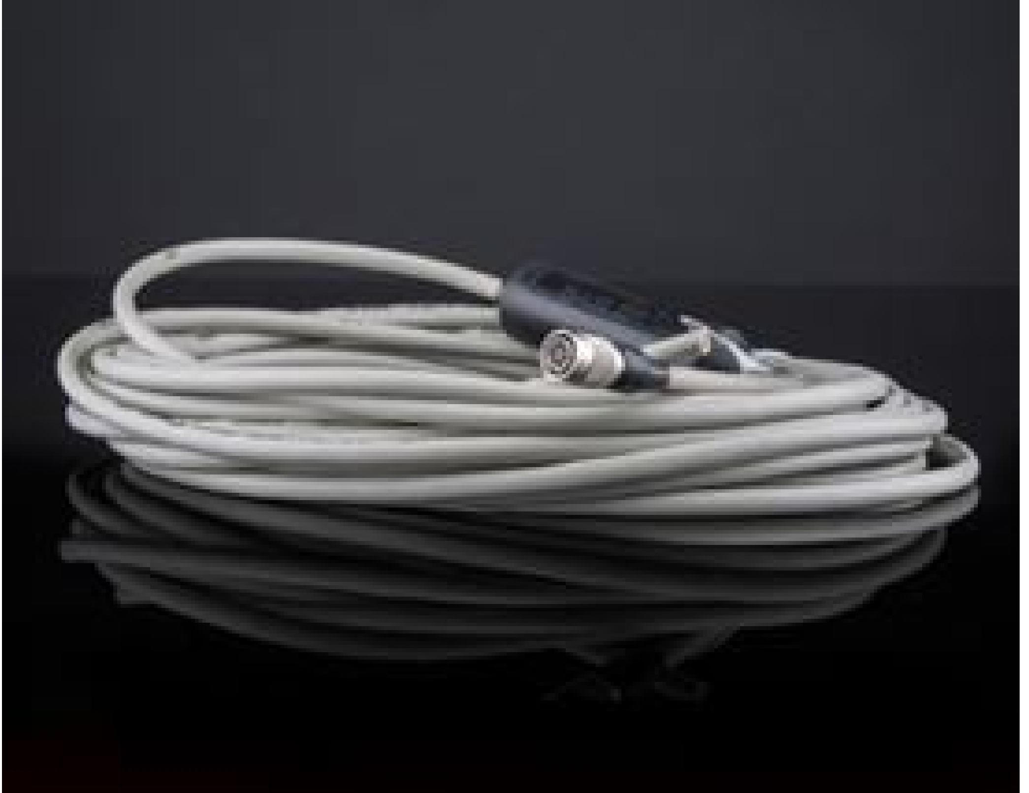
PLC (Programmable Logic Controller) I/O Cable Hirose 6 Pin 10m, #68-467