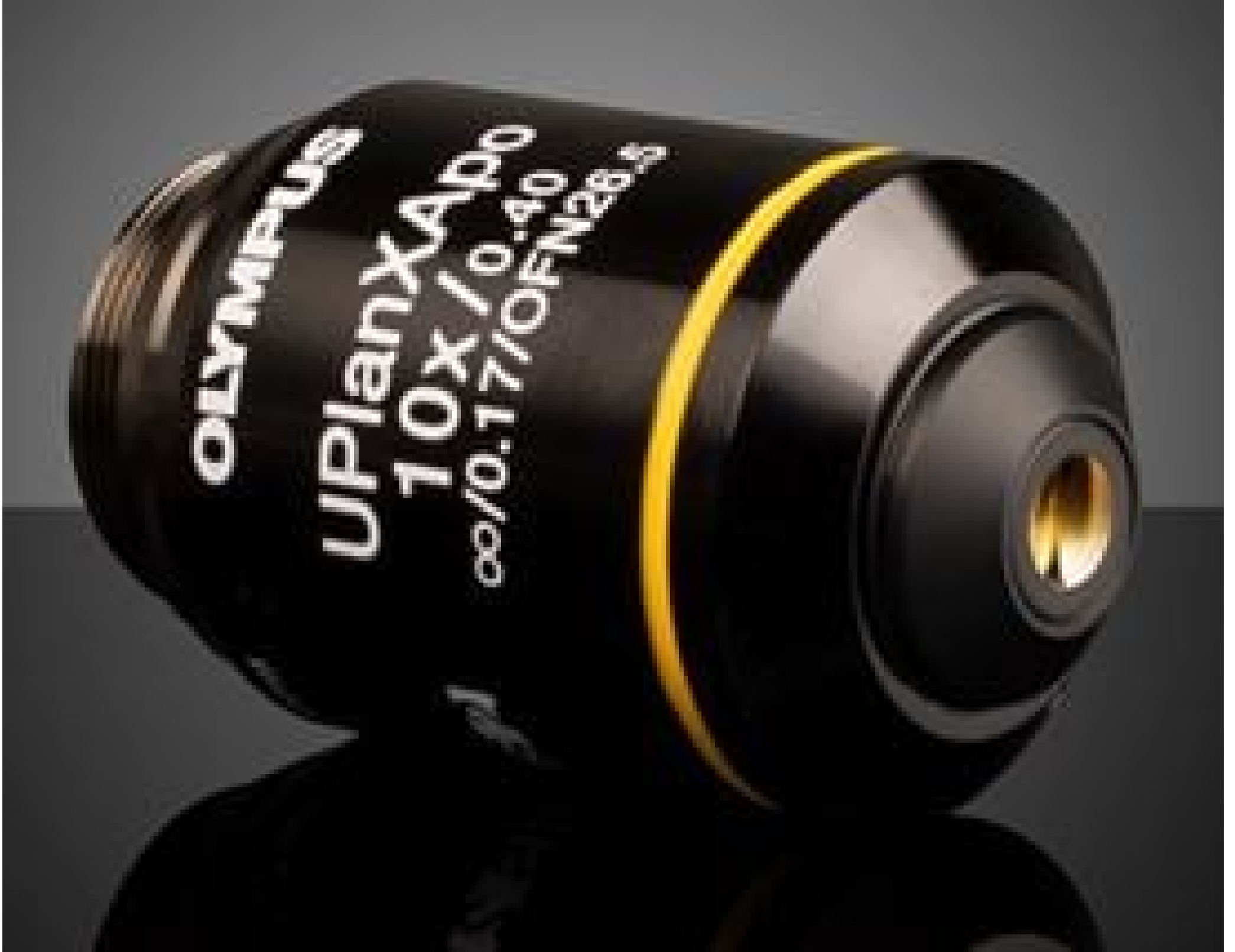
Olympus UPLXAPO 10X Objective, #14-906