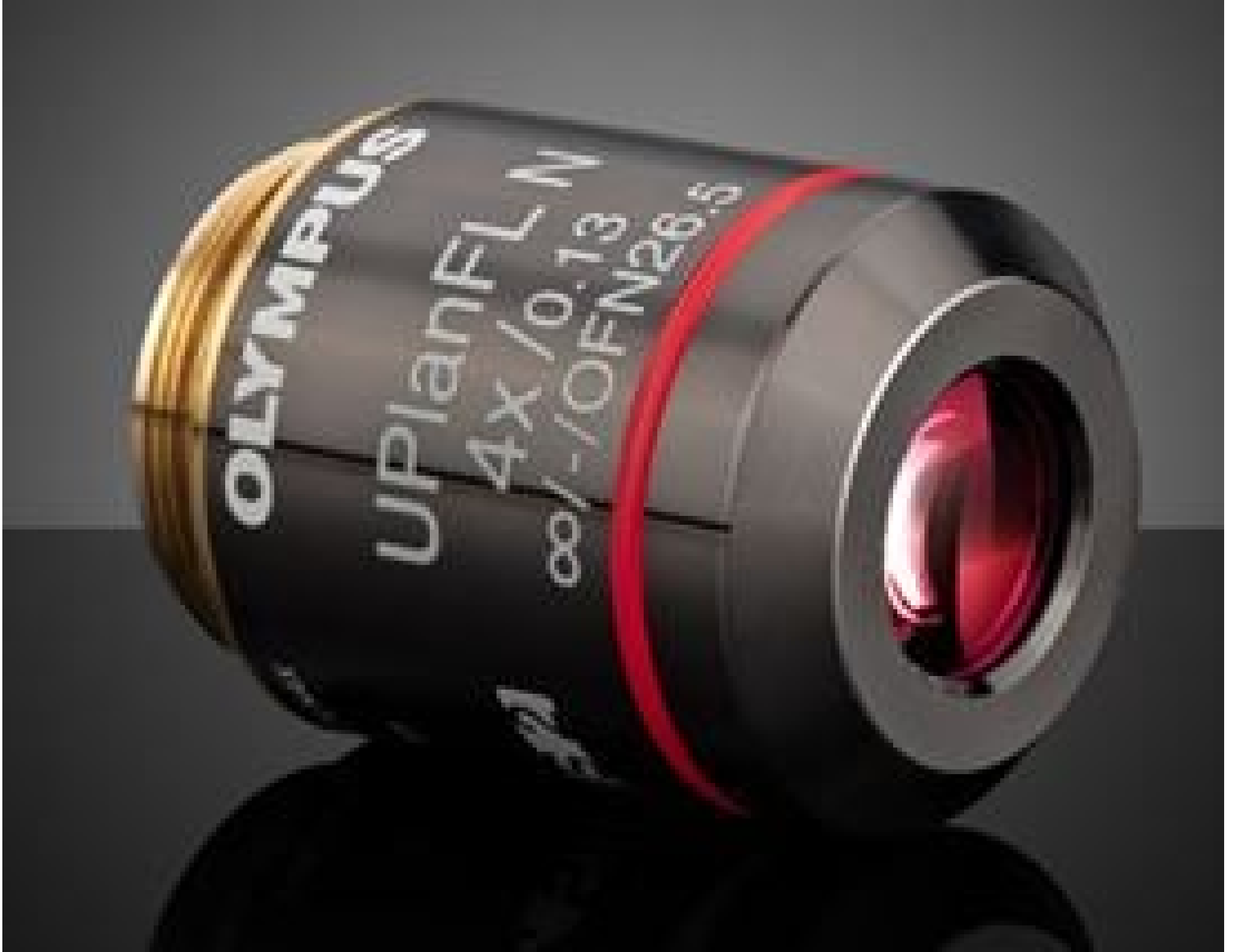
Olympus UPLFLN 4X Objective