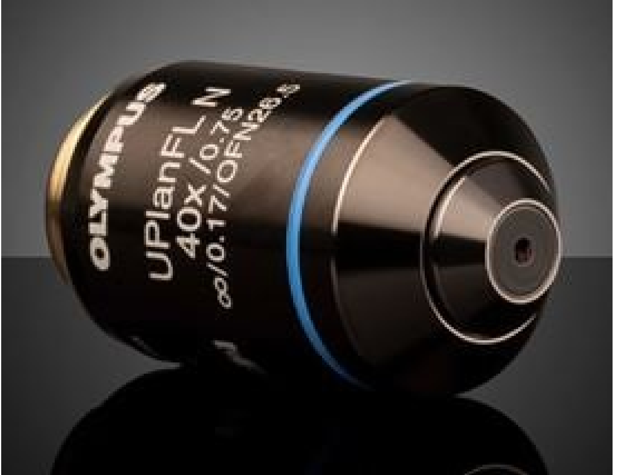
Olympus UPLFLN 40X Objective