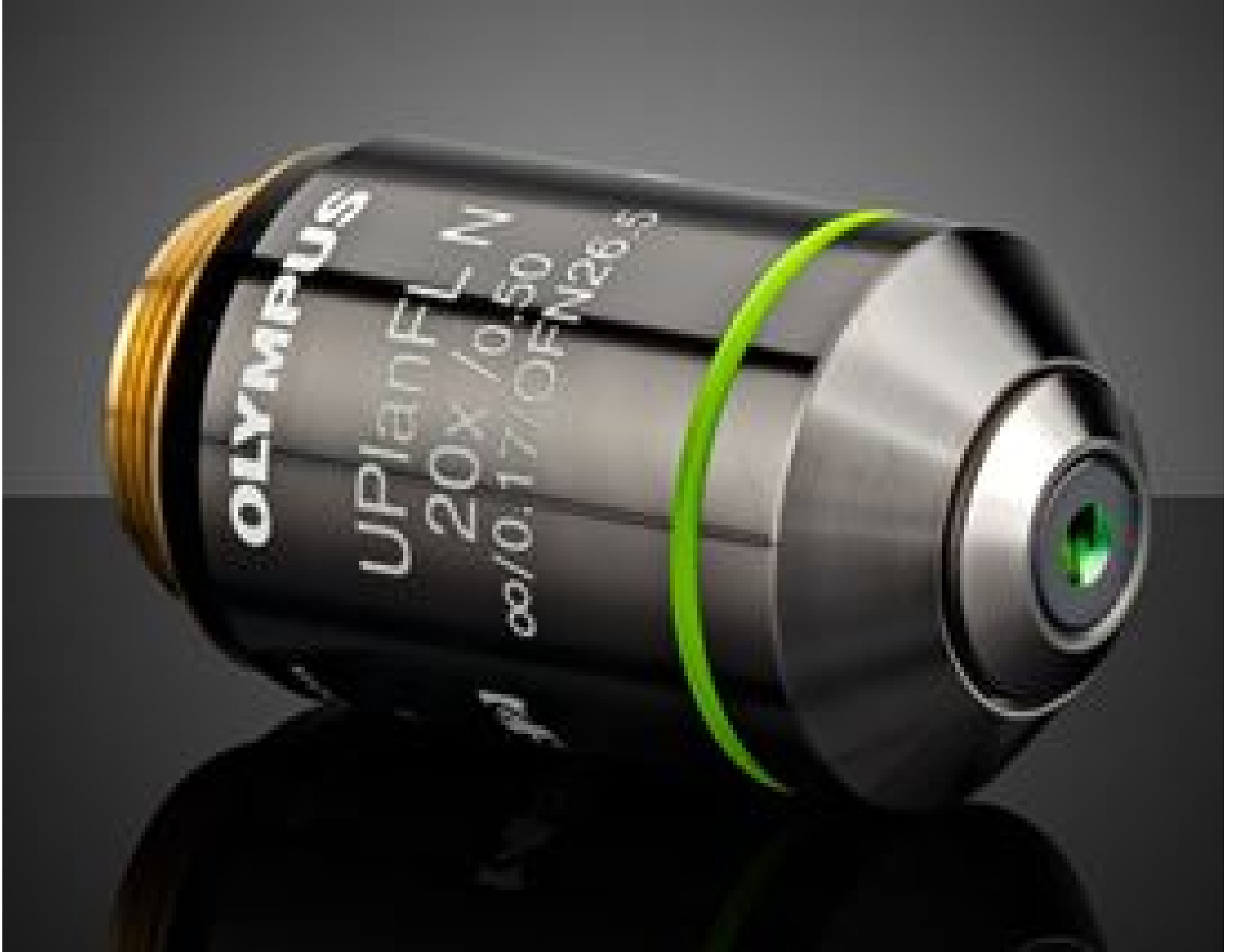
Olympus UPLFLN 20X Objective