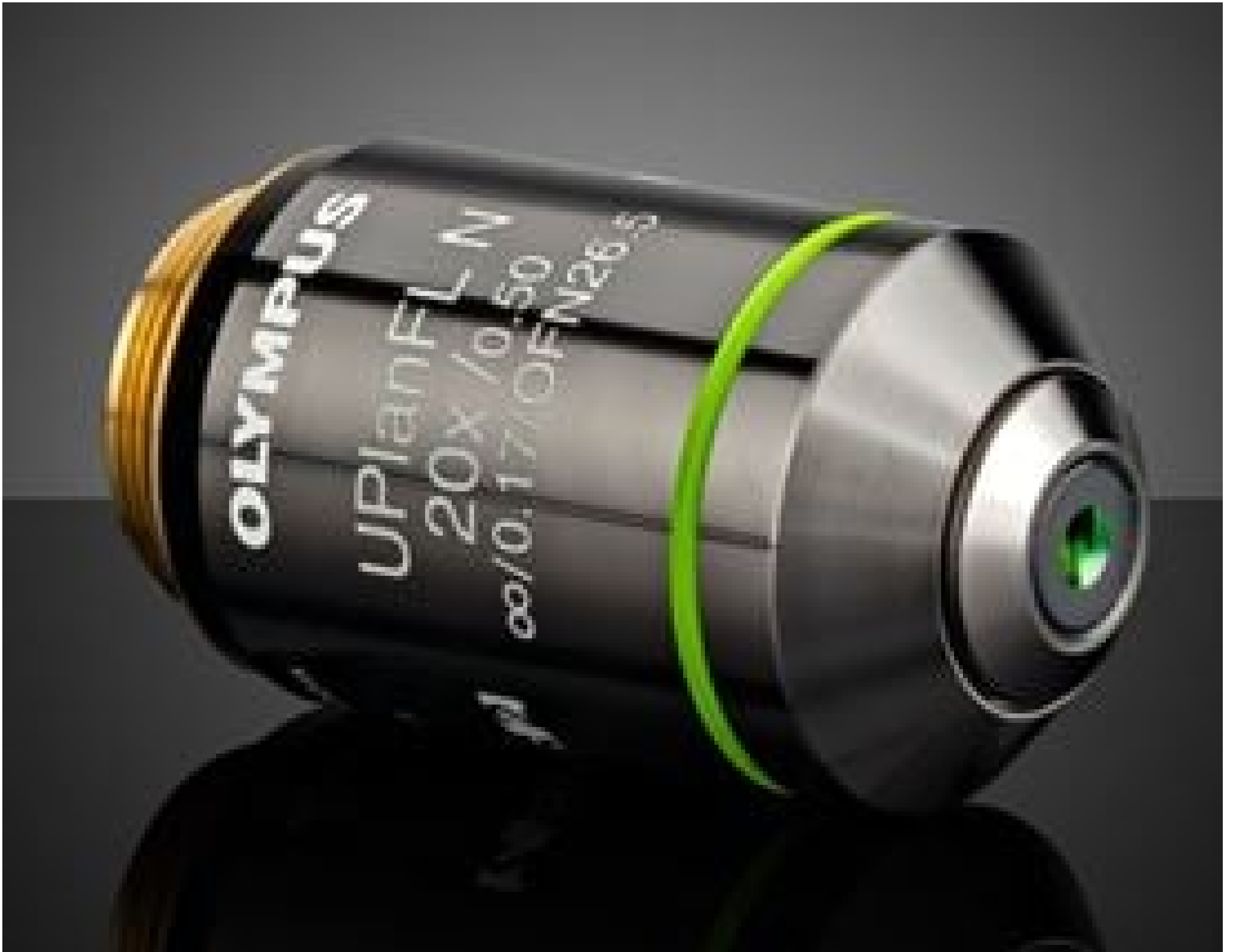
Olympus UPLFLN 20X Objective