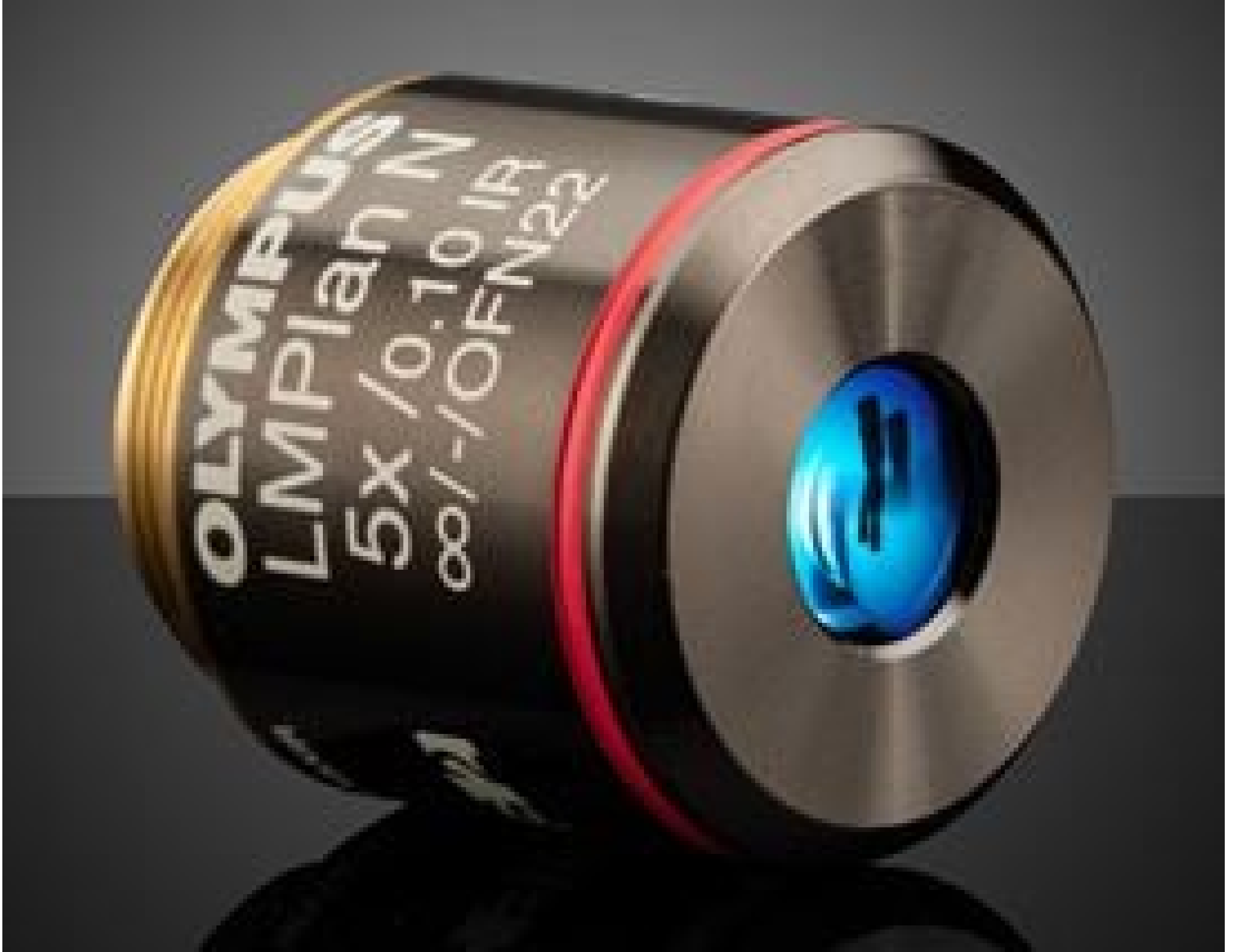
Olympus LMPLN5XIR 5X NIR Objective