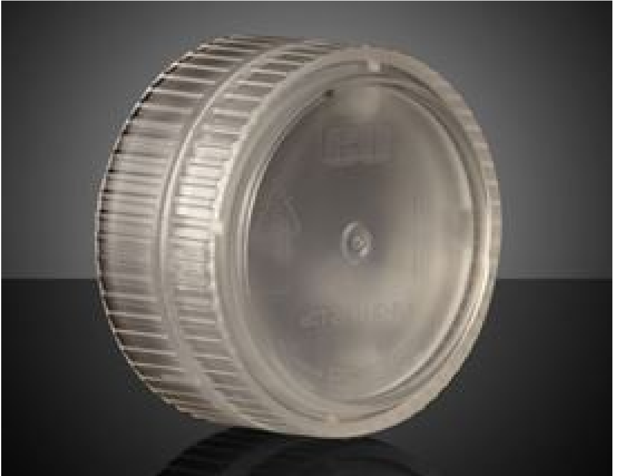
Non-Contact Impact Case for 25.4 Dia. Optics