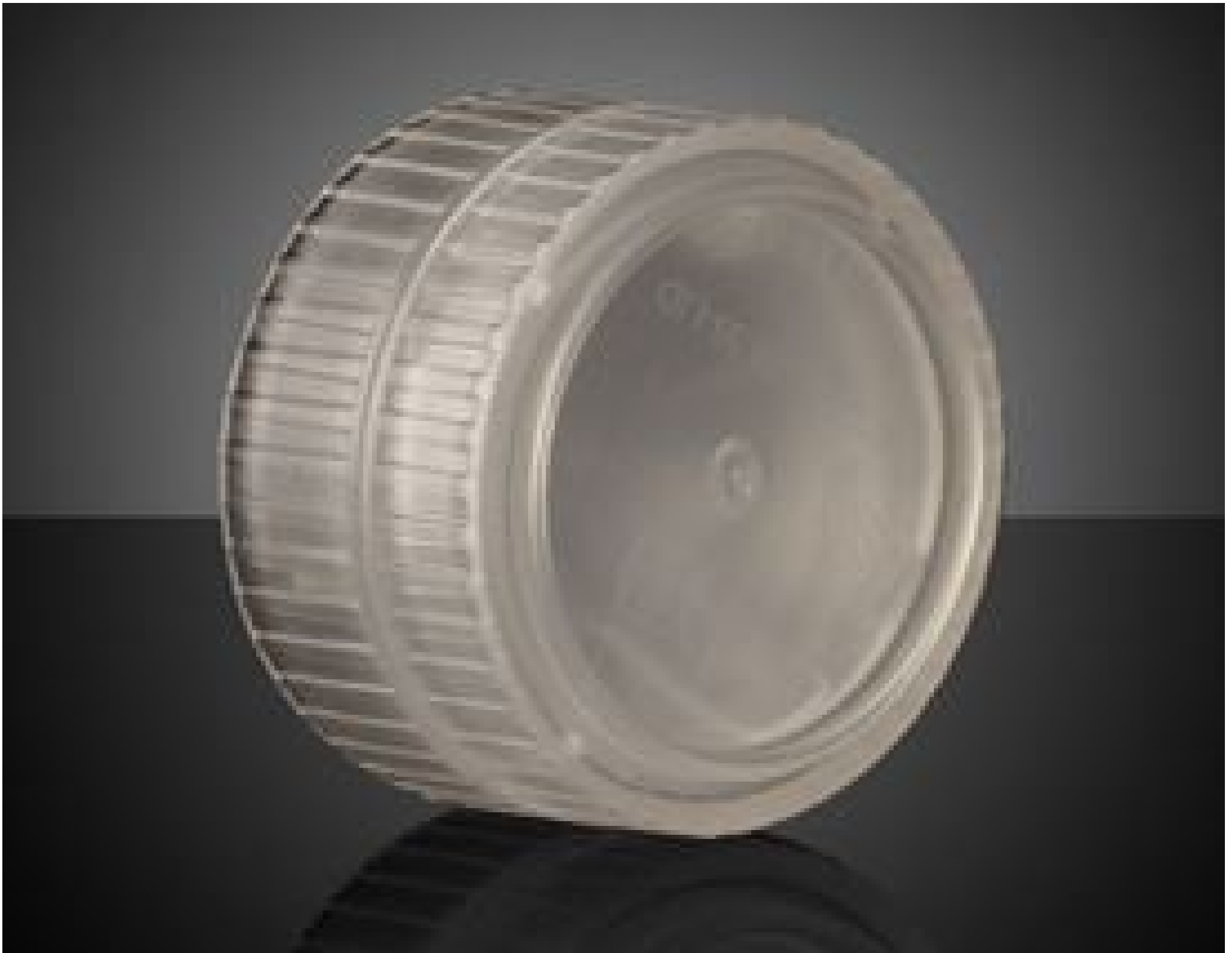
Non-Contact Impact Case for 19.1 Dia. x6.35mm Thick Optics