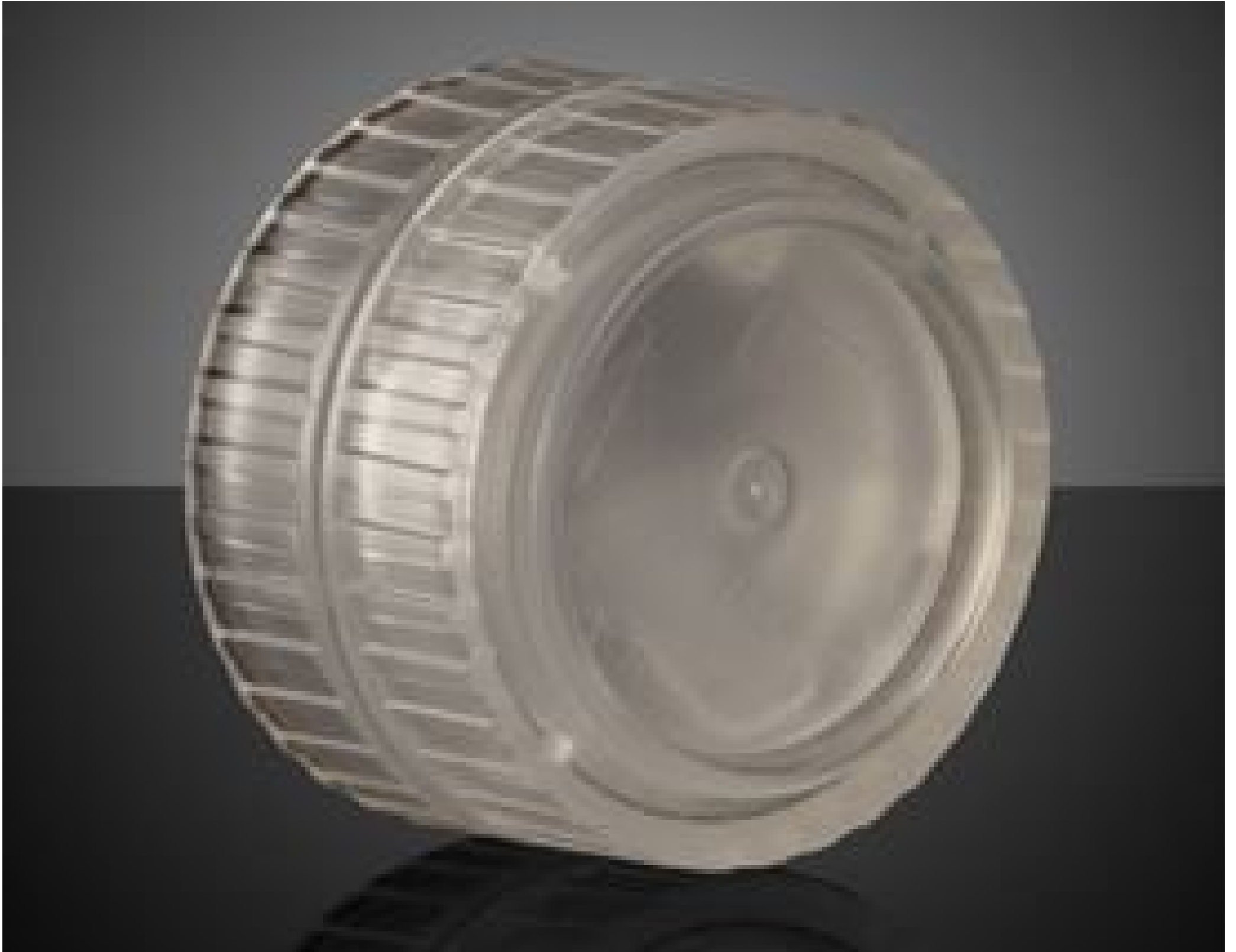
Non-Contact Impact Case for 12.7 Dia. x6.35mm Thick Optics