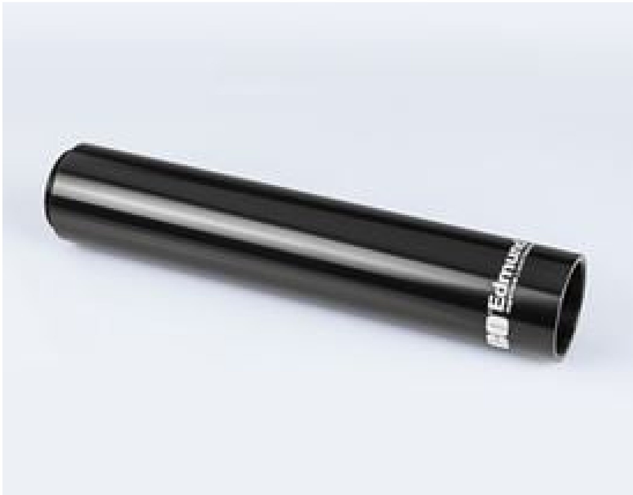
Mitutoyo to C-mount Camera 152.5mm Extension Tube, #56-992