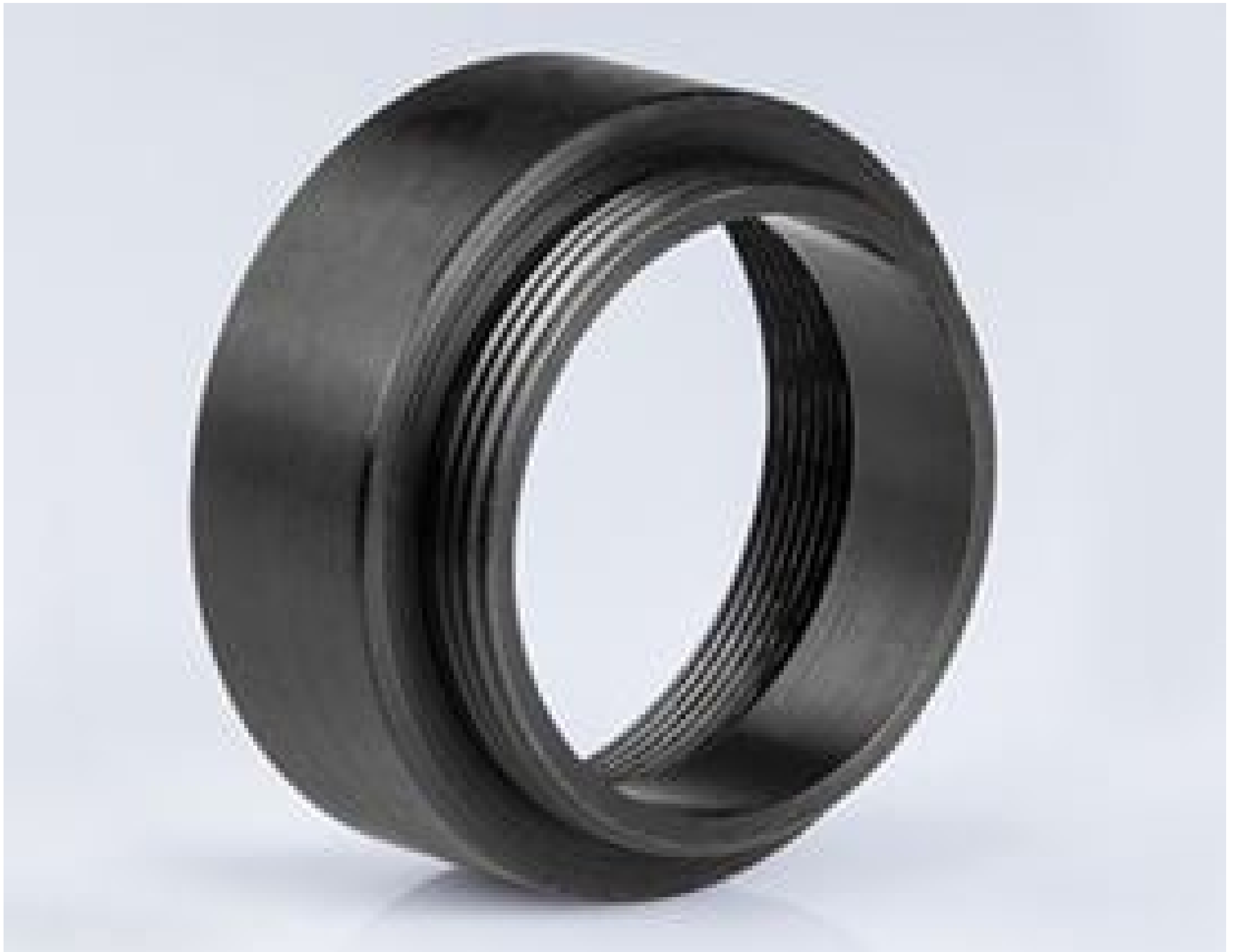
Mitutoyo to C-mount 10mm Adapter, #55-743