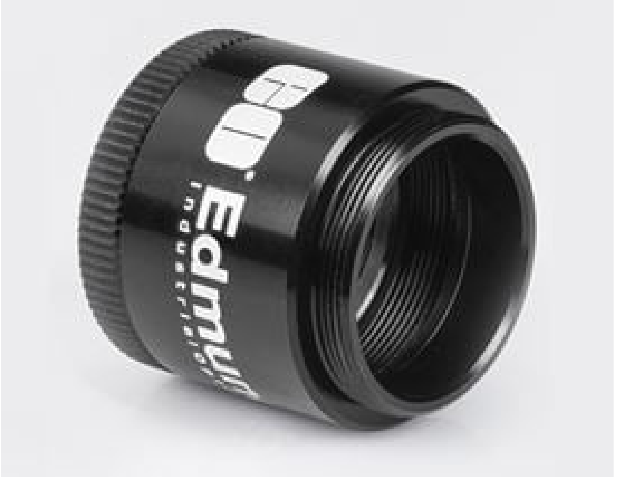
Mitutoyo Filter Holder, #56-993