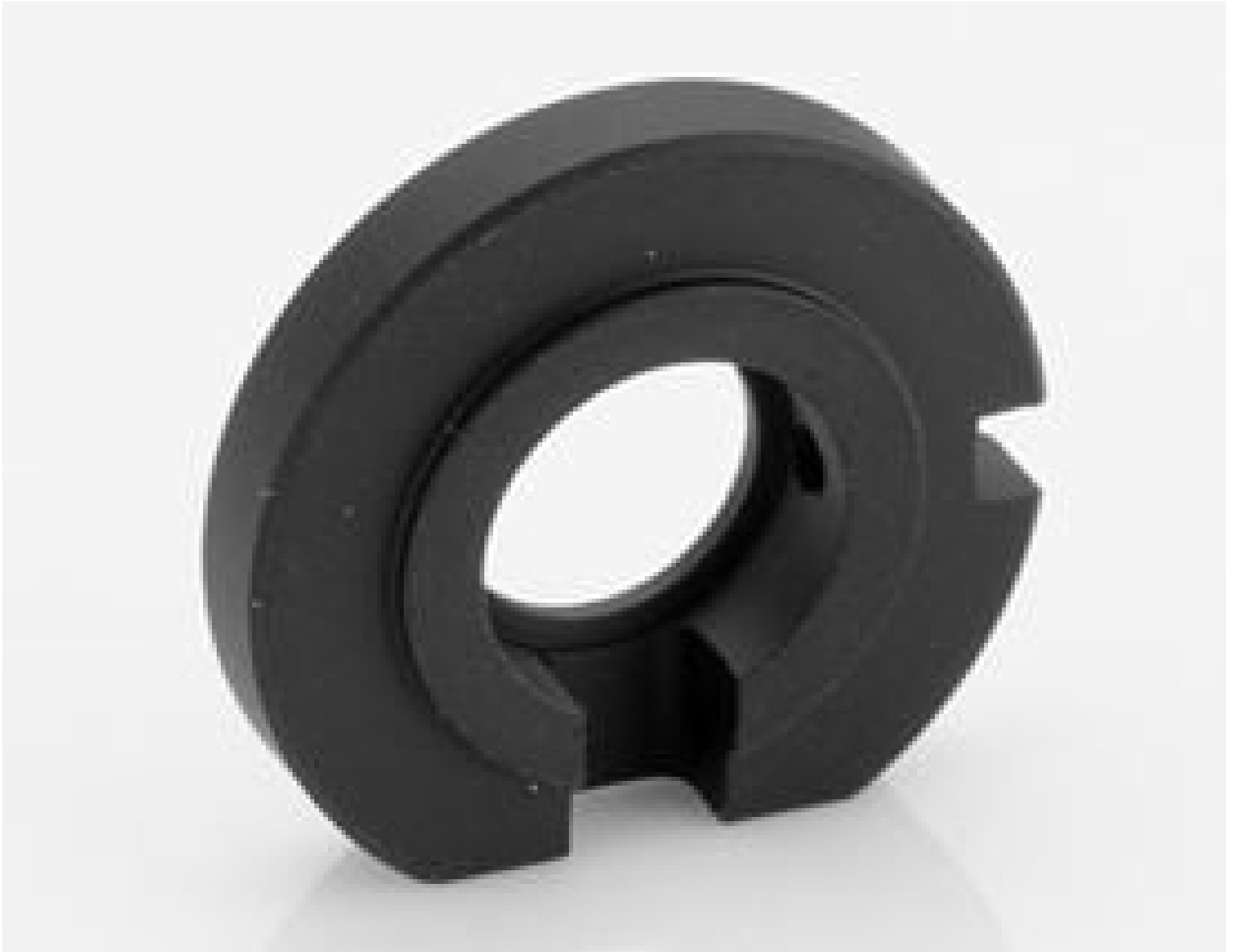
#33-631: Liquid Lens Holder for 12mm CxLens