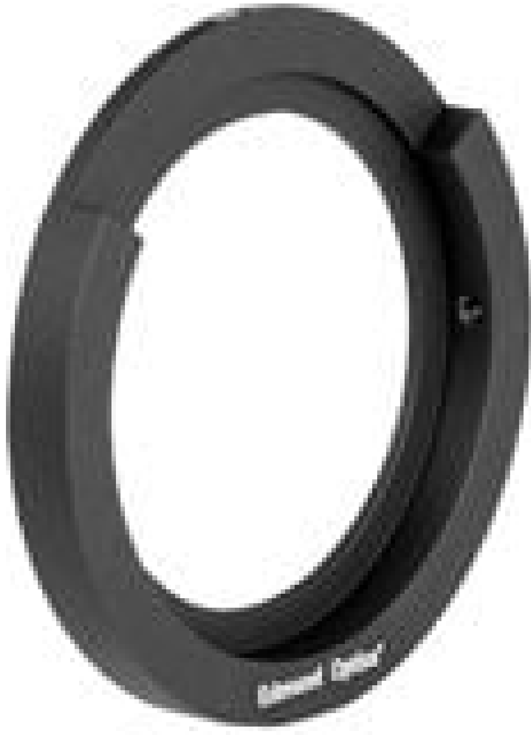
Iris Mount for 70mm Outer Diameter Irises, #53-921