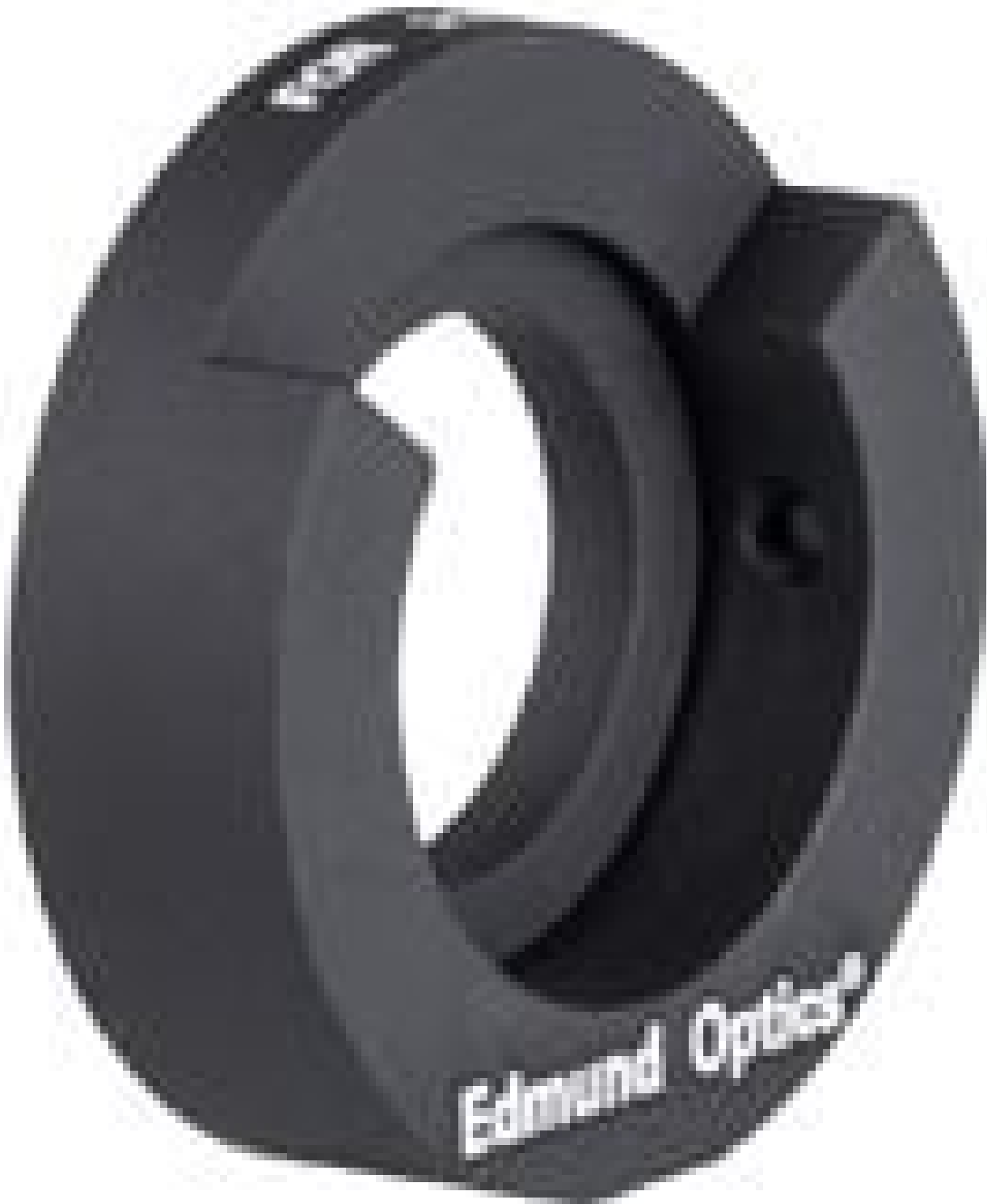
Iris Mount for 21mm Outer Diameter Irises, #54-862