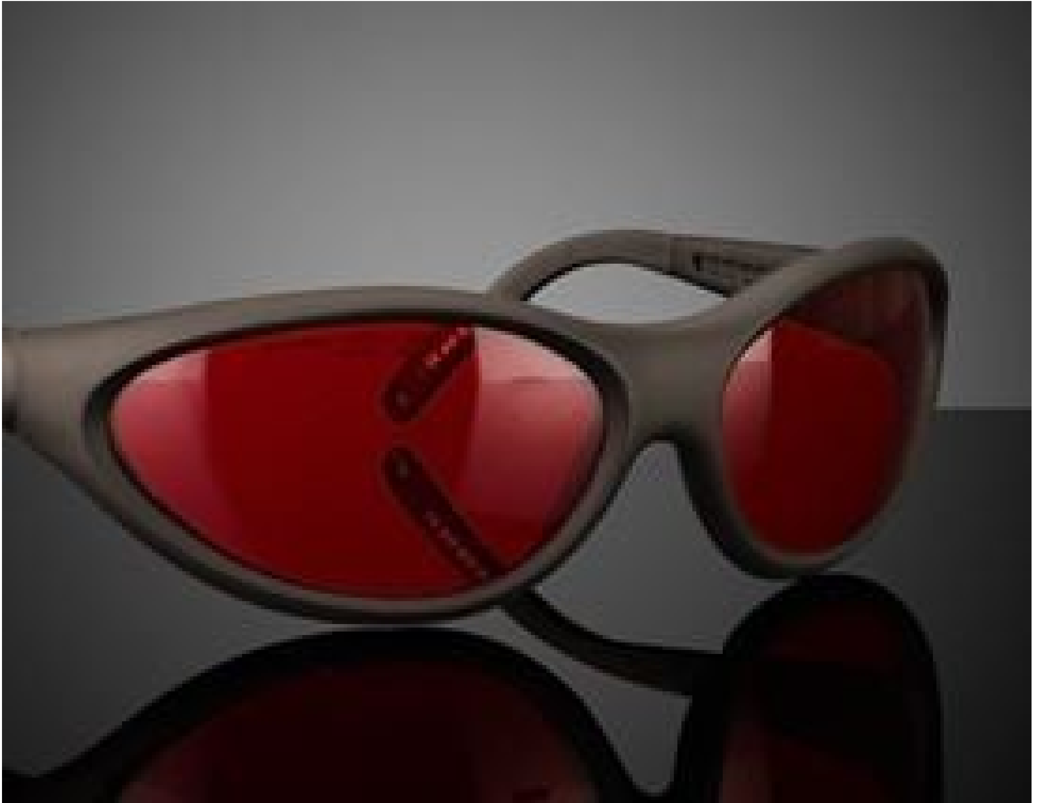
Image represents frame style only. Filter color will vary by product specification.