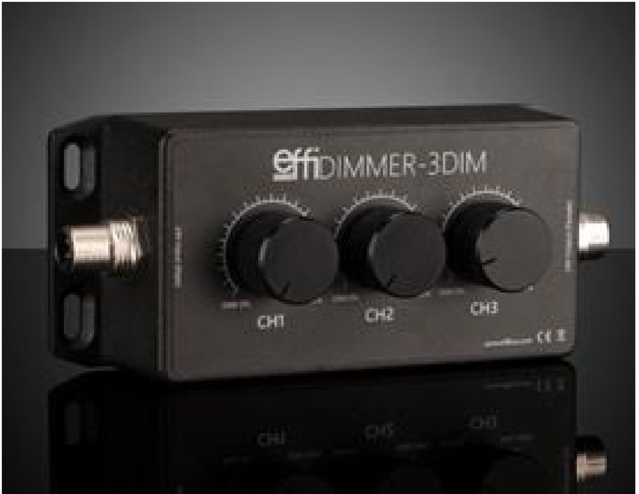
Intensity Adjustment Potentiometer for Effilux LED Lights