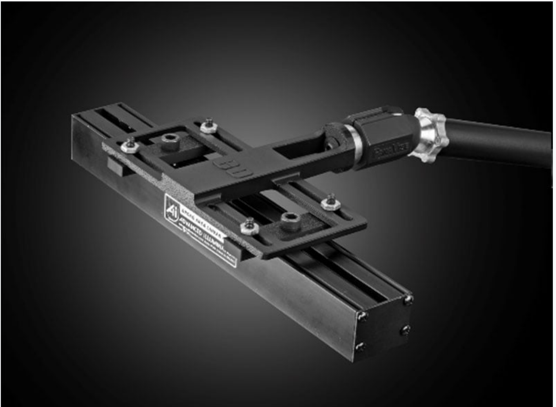
Configuration pour barres lumineuses ou éclairages linéaires