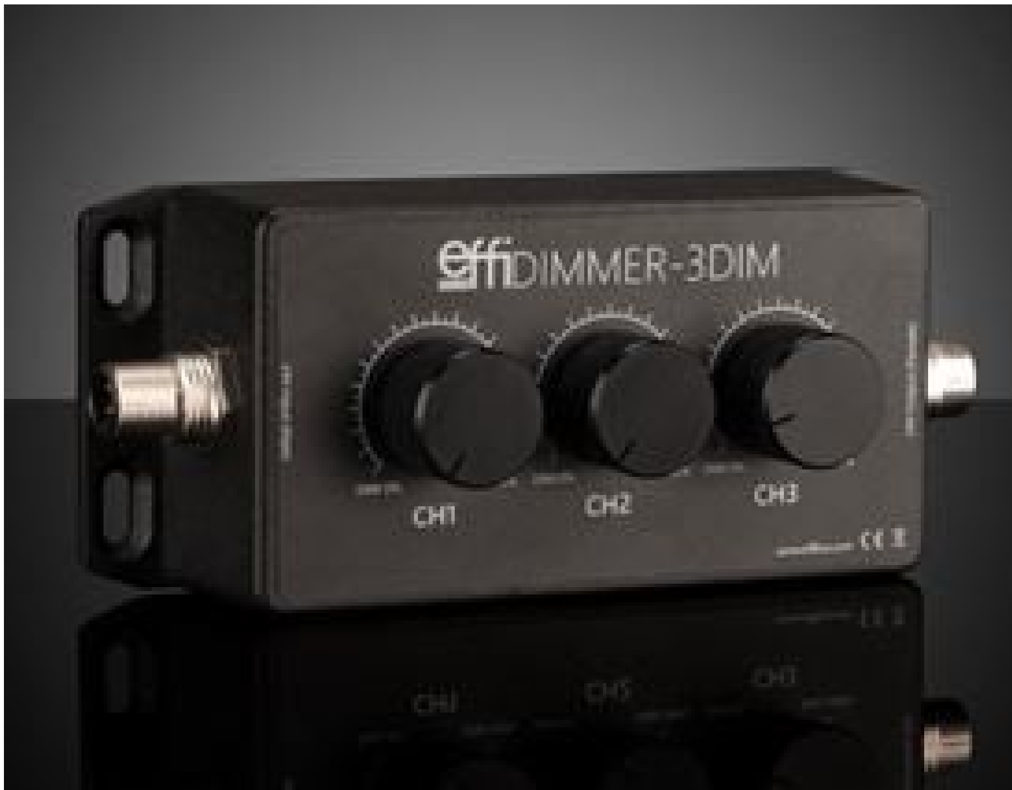
Intensity Adjustment Potentiometer for Effilux LED Lights