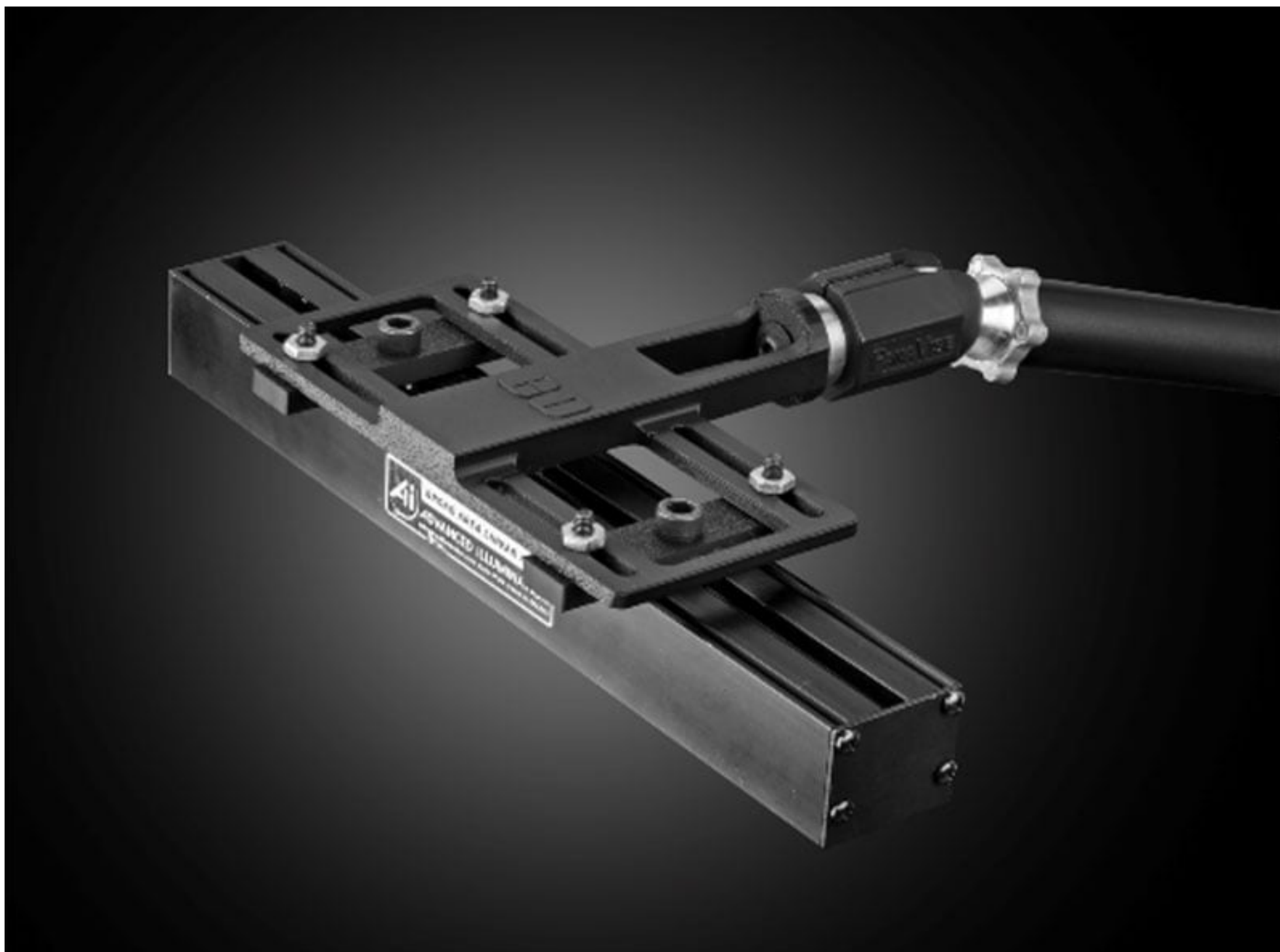
Configuration pour barres lumineuses ou éclairages linéaires

Fichiers pour montures imprimables en 3D