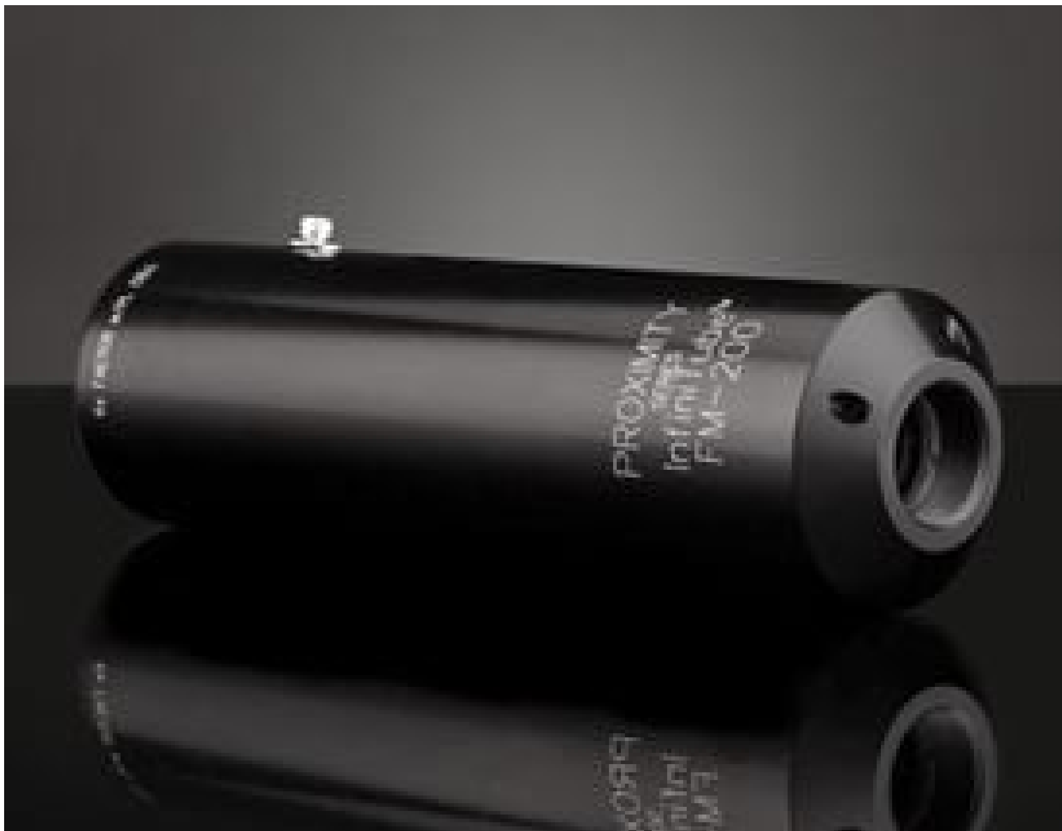
InfiniTube FM-200 (1X), #58-310

See More by Infinity Photo-Optical Company