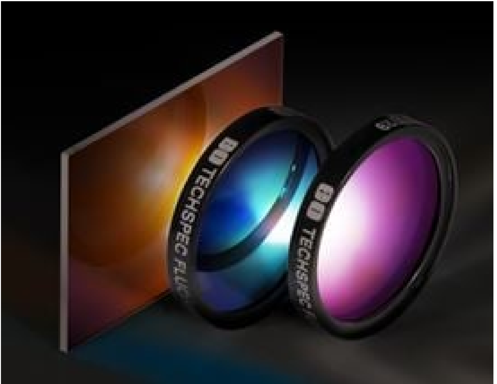
Fluorescence Filter Sets