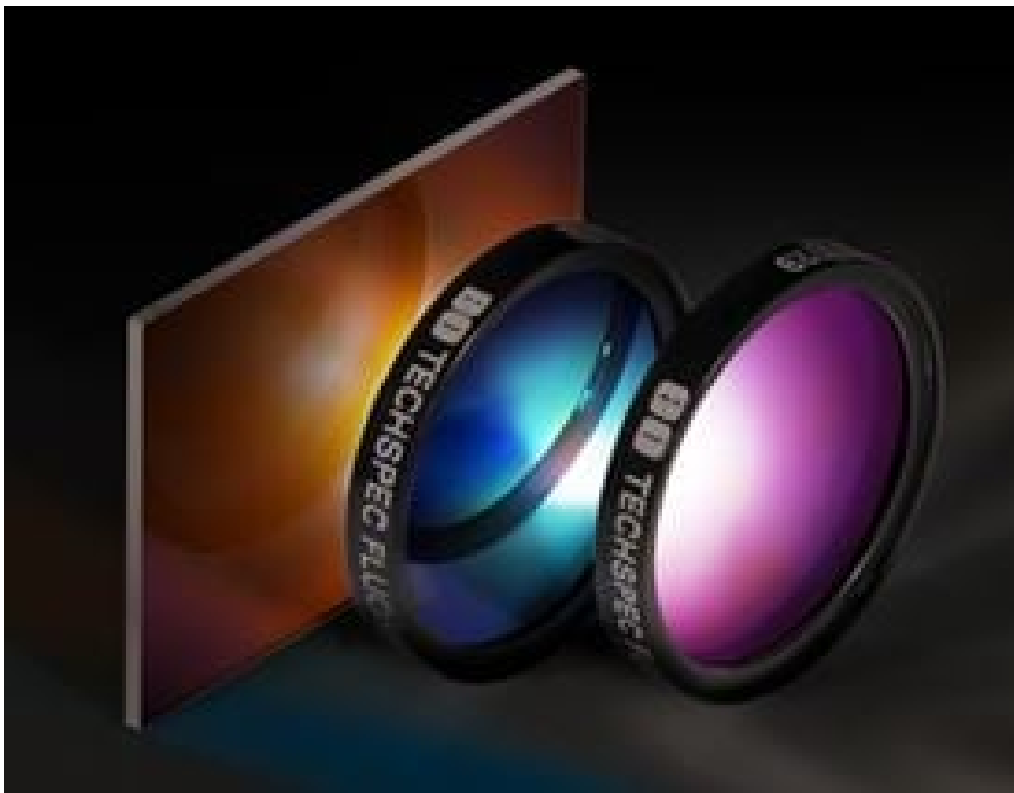
Fluorescence Filter Sets