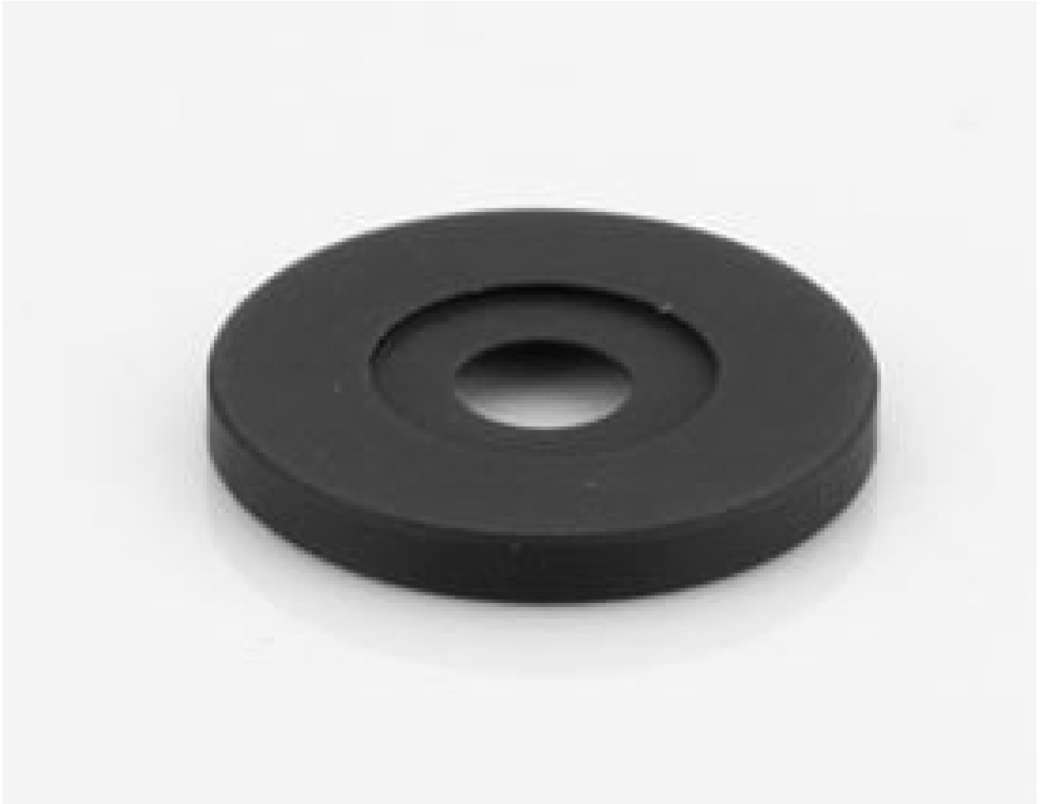
Aperture for Cx Lens (representative photo). Aperture varies by stock number. View PDF drawing for additional information.