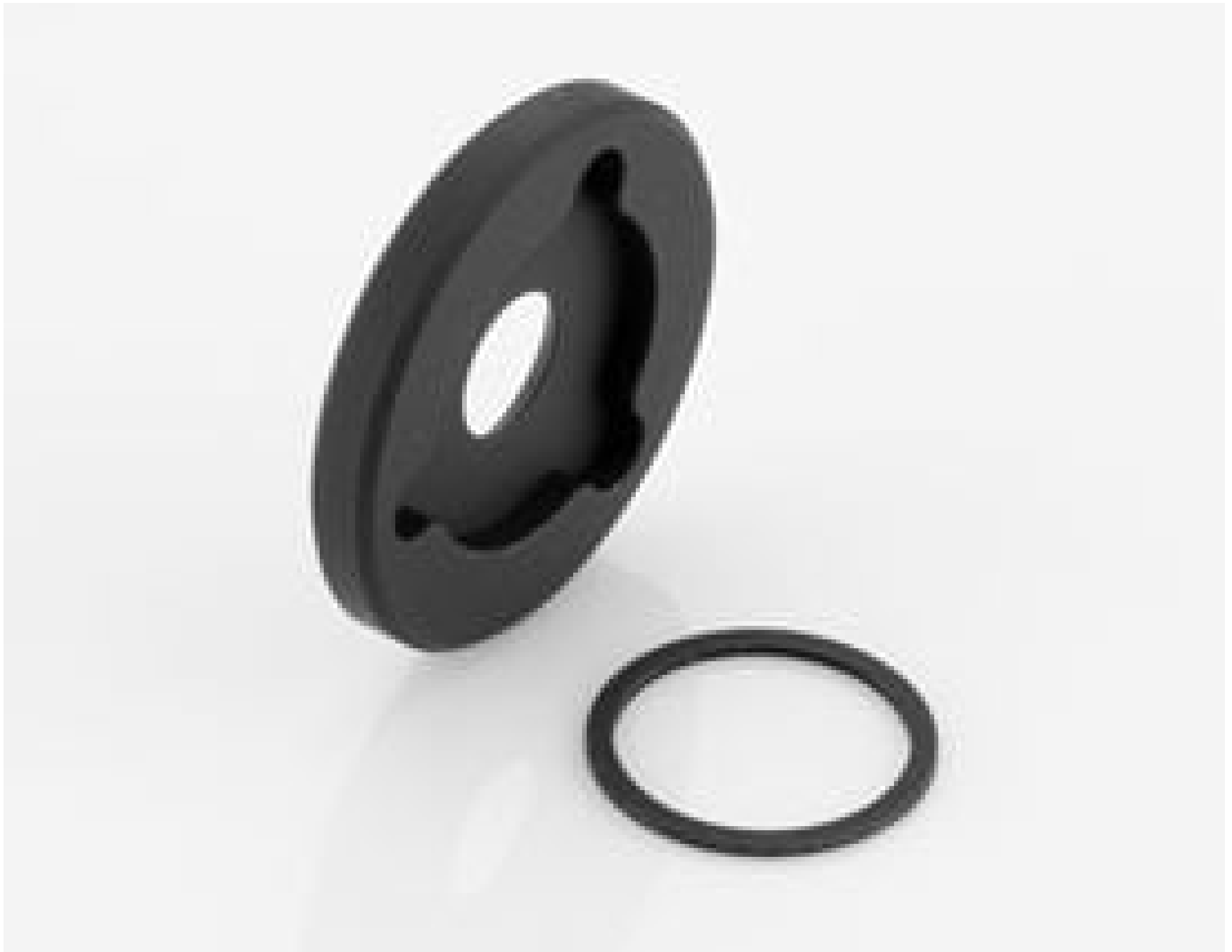
Filter Holder for Cx lens