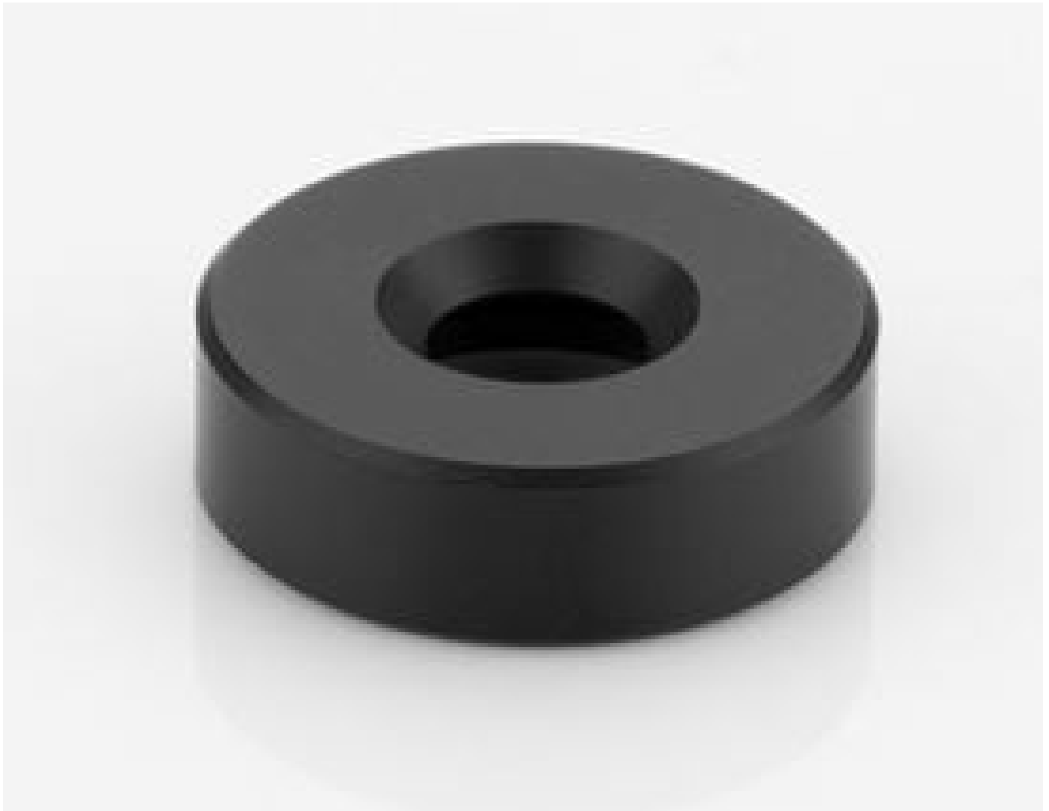
Filter Holder for 50mm Cx Lens (representative photo). Filter Holder varies by stock number. View PDF drawing for additional information.