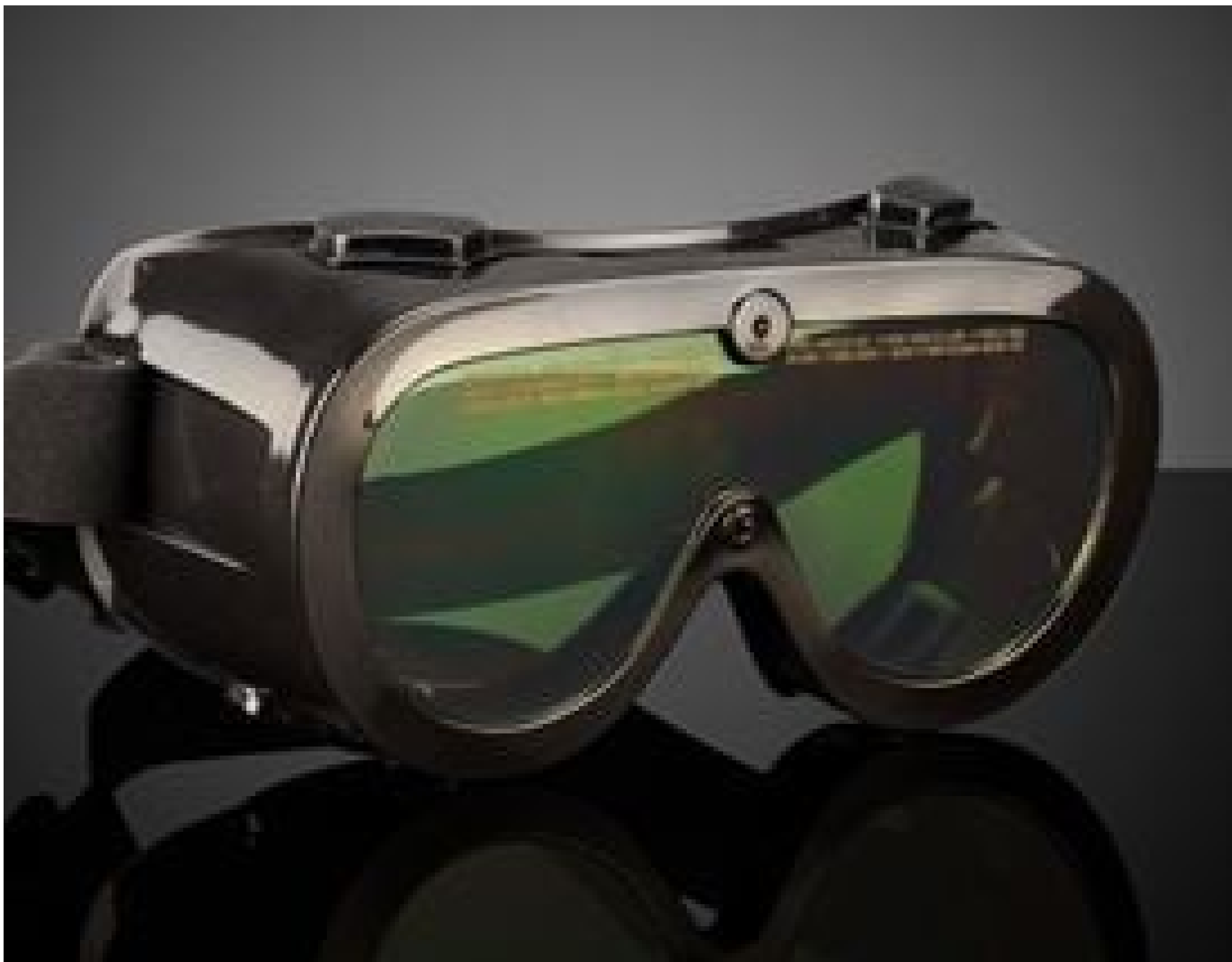
Image represents frame style only. Filter color will vary by product specification.