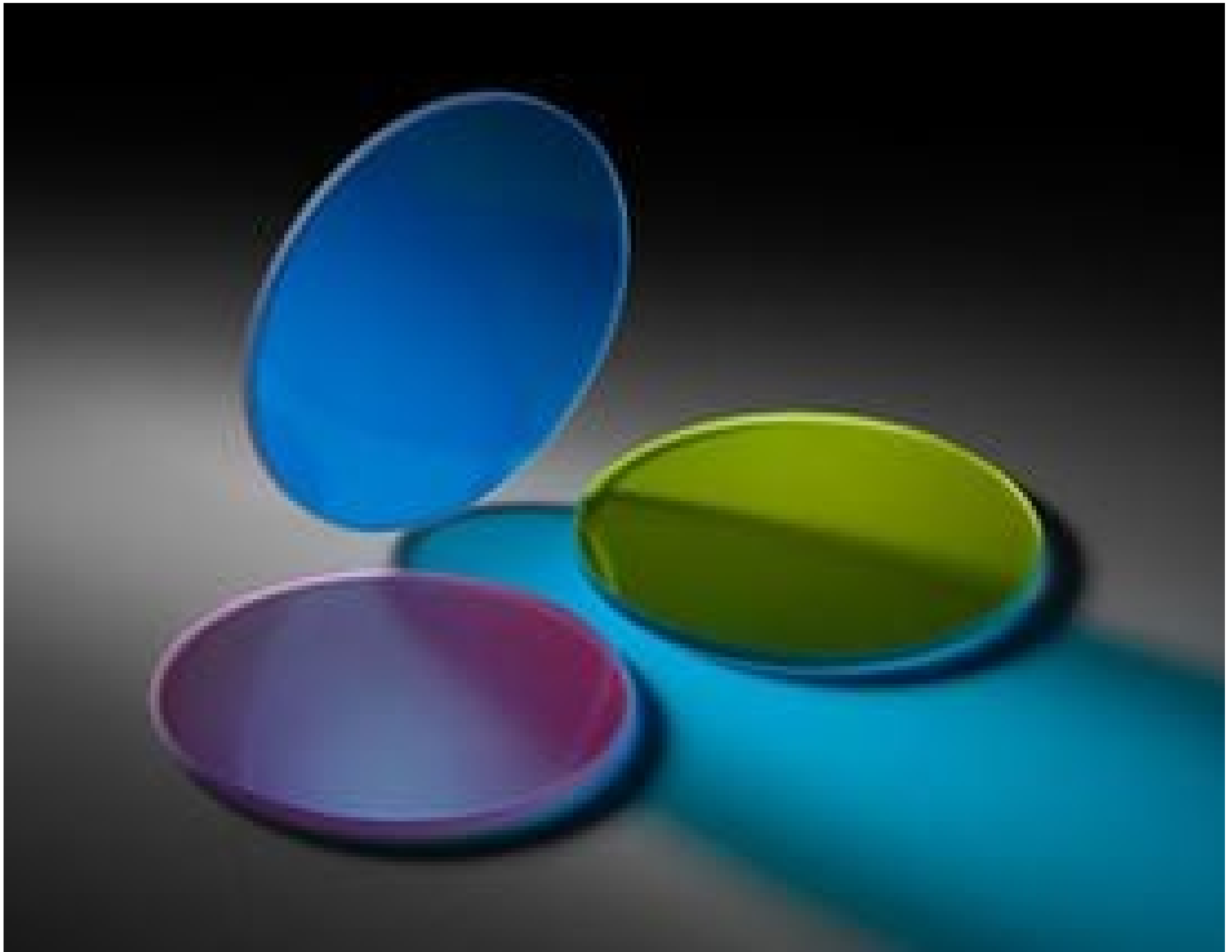
Cyan, Yellow, and Magenta Dichroic Filter Kit