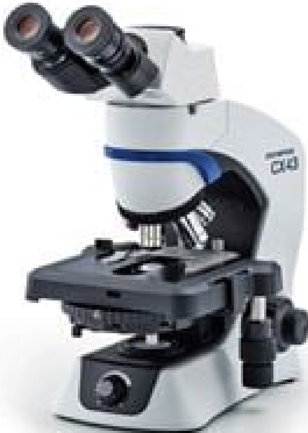
Image shown is full assembly. Each component sold separately. See Technical Information tab for additional details.