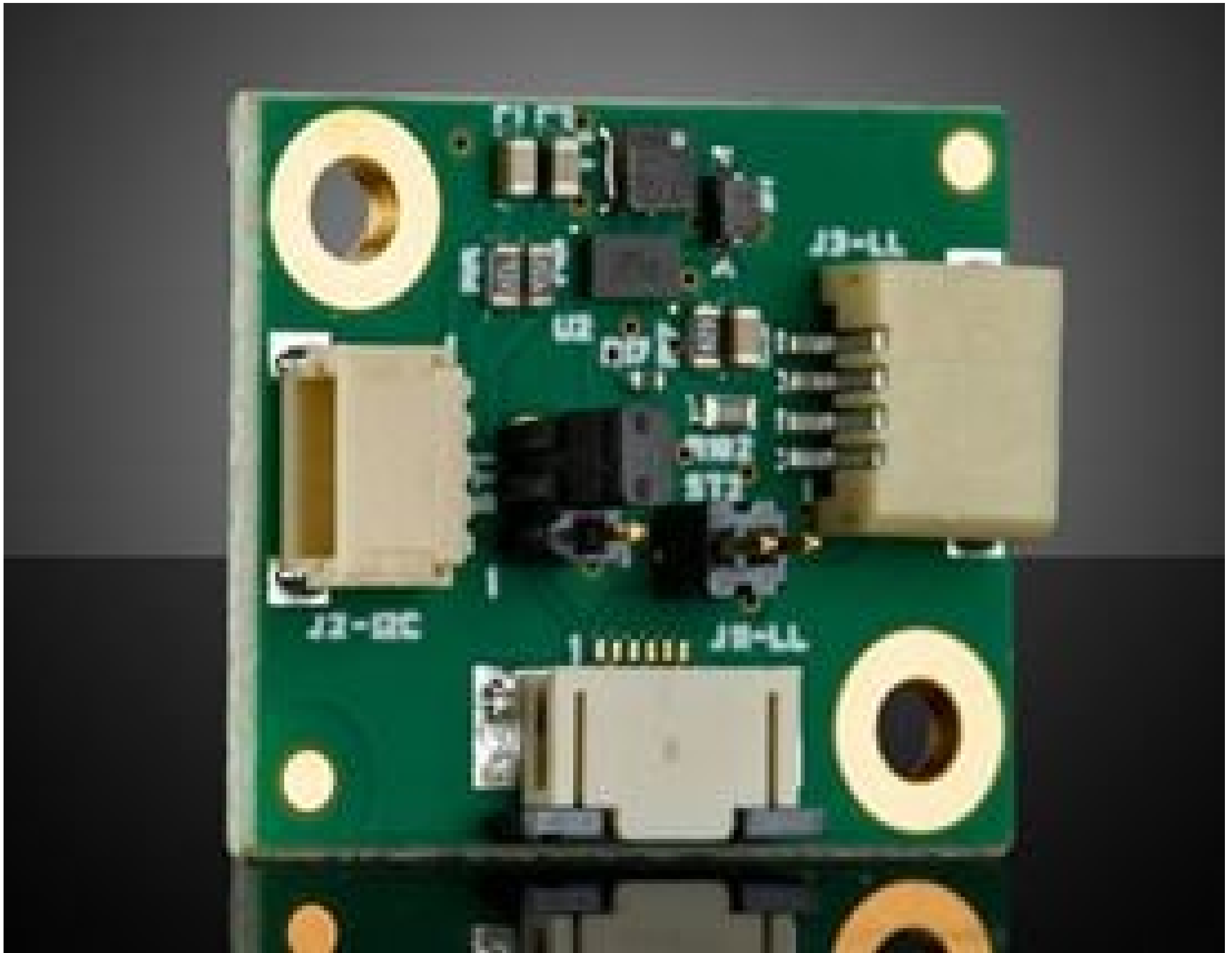
Corning® Varioptic® Variable Focus Liquid Lens Driver Board with Maxim MAX14574 Driver and I2C/DC Input